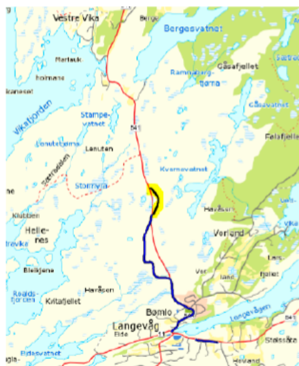
FG. 541 hp 5 km 3,820 – 4,201, lengde 381 meter

Strekninga frå Langevåg til Løvegapet vart opna i 2008. Den nye vegen er ein tofeltsveg med fartsgrense 80 km/t utan eige tilbod til mjuke trafikantar. Om lag 1120 meter av vegen er bygd som ny veg. Den gamle vegen ligg som to sløyfer, ei på 1022 meter på austsida og ei på 381 meter på vestsida av den nye fv.541, sjå kart under. Dei to sløyfene er registrert som fylkeskommunal gangveg (FG) i Nasjonal vegdatabank (NVDB).