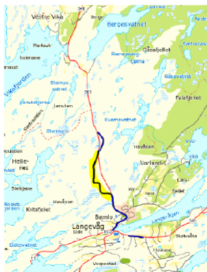
FG. 541 hp 205 km 2,795 – 3,817, lengde 1022 meter