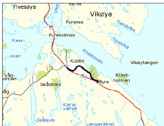
Ft.18 hp 2 km 0,000 – 0,787

I 2015 vart deler av fv.18 på Goddo utbetra. Ved Myra/Klubbo vart vegen lagt i ny trasé. Vegsløyfa som ligg igjen etter at ny trasé opna er 787 meter. Det er 11 adresser knytt til denne vegen, der det er fastbuande i 4 av desse bygningane. Totalt grensar 19 grunneigedomar til vegen.