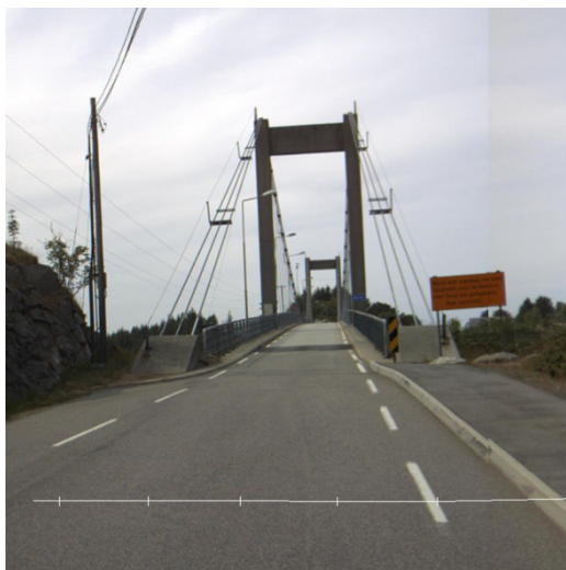
Innkøyring til Herdla bru frå sør

Området [...] ligg like [...] etter overgangen frå 60 til 50 sone på Fv 223. Herdla bru er ei smal bru med [...] krav om sentrisk køyring. Difor er det ofte trong for å vente på møtande bilar ved brua. I sommarhalv året er Herdla eit mykje brukt friluftsområde både for dei som bur på Askøy, men også for folk generelt i Bergensområdet. På denne årstida er trafikken på staden av eit heilt anna volum enn til dømes i vinterhalvåret. [...] Som eit resultat av å vere eit ynda utfartsområde har det vore mangel på parkeringsplassar. Ofte tek ein i bruk fylkesvegen som parkeringsareal. I tillegg er trafikken over Herdla bru så stor at det frå tid til annan er kø med bilar som venter på å krysse over. Det er difor svært uheldig at ein no søker om etablering av avkøyrsløse så nær opp mot brua. På dagar med mykje trafikk, sjølv om denne pr. i dag ligg på eit snitt på omlag 600 bilar, så vil omsøkte avkøyrsløse liggje uheldig til med tanke på inn og ut køyring på Fv 223, ved slike situasjonar. I tillegg er vår erfaring at fartsnivået på Fv 223 er høgt. Med ein overgang frå 50 til 60 sone like aust av omsøkt stad, ser vi at på dagar med mykje trafikk at det er risiko for trafikkulukker på staden.