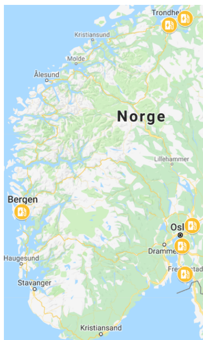
Figur 2: Planlagde stasjoner per januar 2019

Dei ikona med lyseblå farge er stasjonar med 700 bar trykk, som altså er berekna for personbilar. Desse vert brukt av dei 144 hydrogenbilane ein har i drift i Noreg i dag. Tilsvarande er ikonet med lilla farge ein stasjon med 350 bar trykk, som er berekna for bussar. Denne vert i dag brukt av Ruter og deira 5 hydrogenbussar. Ruter har for øvrig planar om å auke dette til 15 hydrogenbussar i 2020.