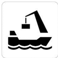
Skilt 776 Godshavn