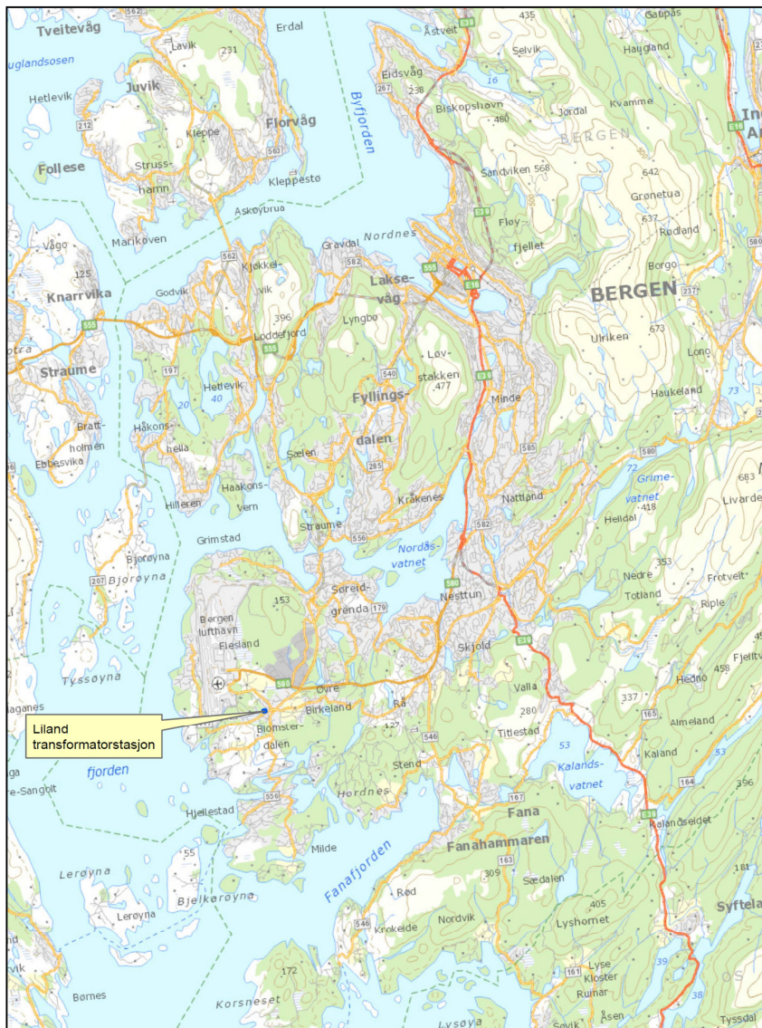
Fig. 1 Liland transformatorstasjon. Oversiktskart.

Tiltaksområdet ligg på Liland i Ytrebygda bydel i nærleiken av Lønningsflaten næringsområde i Fana i Bergen kommune, sjå fig. 1.