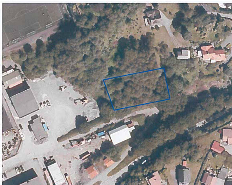
Fig. 3 Flyfoto med tomta for transformatorstasjonen teikna inn