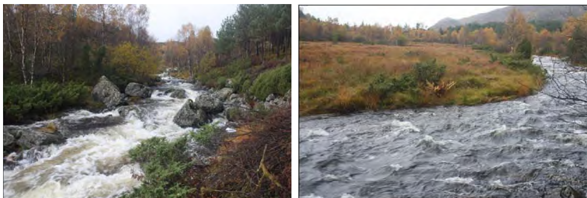
Fig. 3 Typisk parti i Brekkeelvas øvre del

Etablering av inntaksdam som planlagd, vil marginalt påverka grensa for inngrepsfrie område (INON). Det største eksisterande inngrepet er traktorvegen opp langs vassdraget (markert i blått på fig.2) og den nye etablerte lysløypa i 2012 (markert med raudt). I nedre delar av inngrepsområdet er det busetnad og allereie store inngrep i naturen.