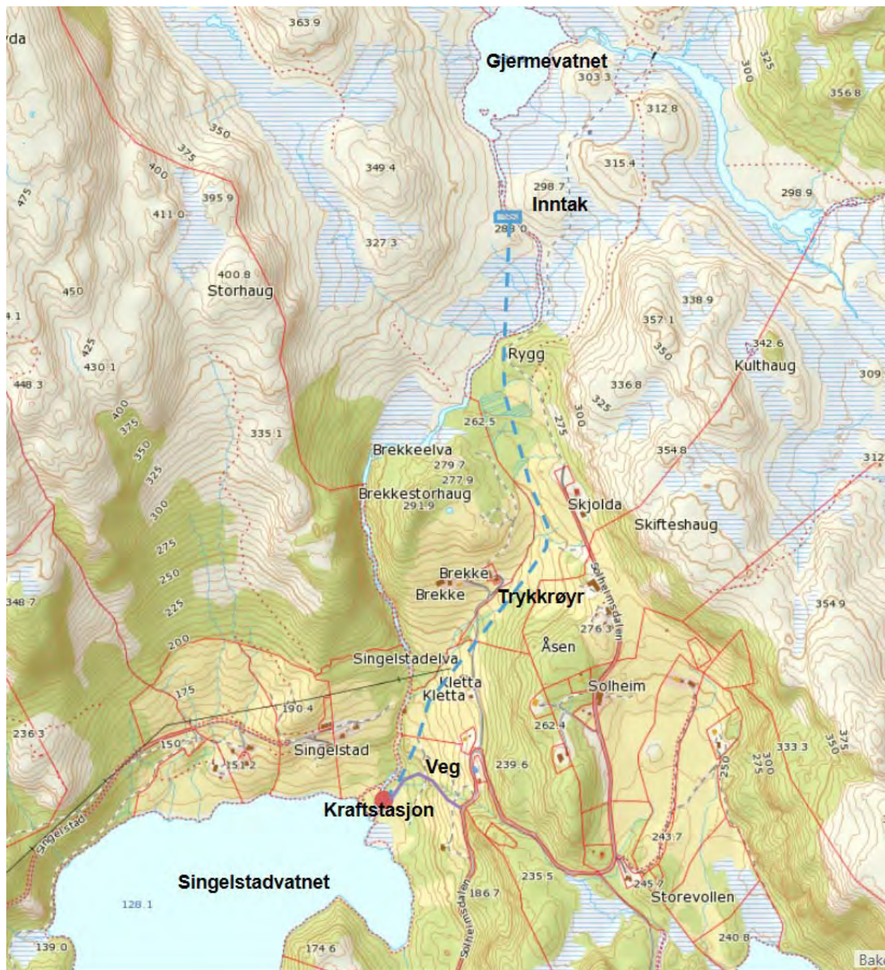
Fig. 2 Kart som syner tiltaket

Utbyggingspris er berekna til 3,7 kr/kWh.