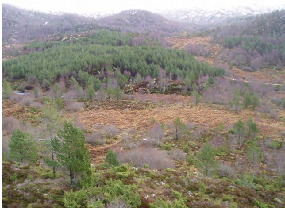
Fig. 4 Landskapet innover mot høgfjellet og Tysnessåta. Inntaksdammen er planlagd i elva til venstre med tilførselsveg frå skogsvegen til høgre.