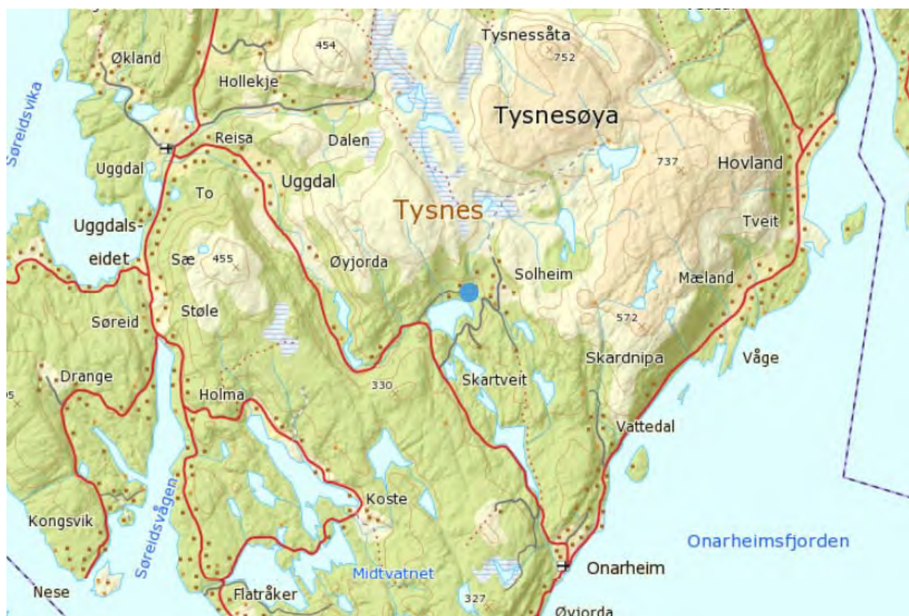
Fig. 1 Plassering av tiltaket

Vassdraget ligg i Tysnes kommune. Tiltaksområdet er lokalisert i Solheimsdalen mellom Gjermevatnet og Singelstadvatnet, om lag 5 km aust for kommunesenteret Uggdal og om lag 5 km nord for tettstaden Onarheim, sjå fig. 1 under.