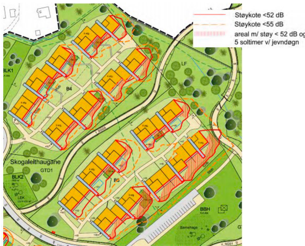
Støy- og solforhold i felt B4 og B5 v/jevndøgn jfr. tabellen under.

Vi viser til illustrasjon fra utbygger og som også kommunens fagetat har tatt inn i sin gjennomgang i 2015 og som er opprettholdt til nå: