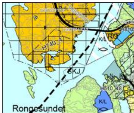
Kartutsnitt: Kommuneplanen sin arealdel.