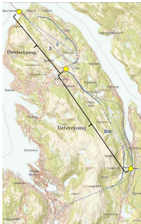
Figur 2 Korridor øst fra utredningen «Ringveg øst og E39 nord i Åsane» (2016)

Strekningen E39 Vågsbotn–Klauvaneset (Nordhordlandsbrua) er i dag rundt 9 kilometer. Med unntak av den relativt nylig etablerte Eikåstunnelen er dette en tofelts veg. Trafikken er høy (ÅDT=20.000) og standarden lav. Tilbud for gående og syklende er mangelfullt, dagens veg påvirker nærmiljøet negativt. Randbebyggelse og mange avkjørsler bidrar til at dette i lang tid har vært en ulykkesutsatt strekning. I forslag til KPA for Bergen kommune (2017) er det for Åsane nord stilt rekkefølgekrav om at området ikke kan bebygges før E39 nord for