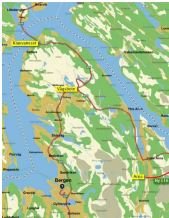
Figur 1 E16 Arna–Vågsbotn og E39 Vågsbotn Klauvaneset

Statens vegvesen laget i 2016 en utredning «Ringveg øst og E39 nord i Åsane» der ulike konsept for ny korridor for hovedvegsystemet ført utenom Bergen sentrum ble vurdert. Utredningen anbefalte et konsept øst med ny vegkorridor via Arna. Utredningen ble behandlet i Bergen kommune, Hordaland fylkeskommune, alle Nordhordlandskommunene m.fl. der alle