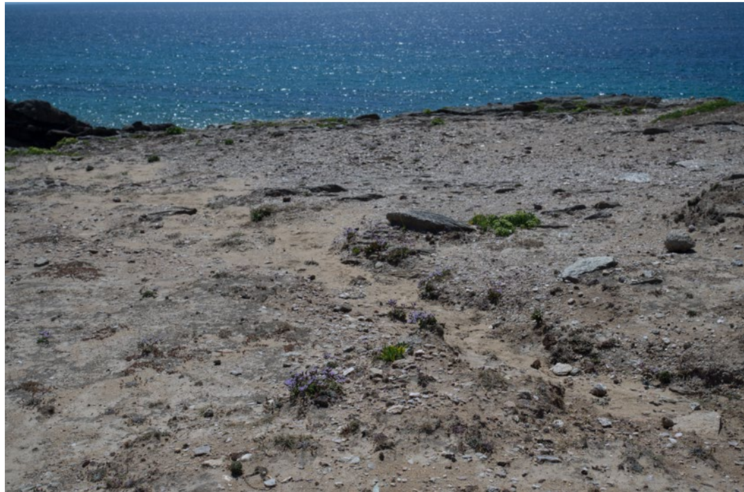
Lysstudie: Notasjoner fra Cap Fréhel og La Côte Sauvage. Immersions in Landscape and Space.