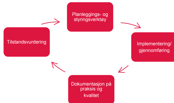
Figur: kvalitetssikring som ein syklus

Planleggings- og styringsverktøy definerer m.a. innhald og framdrift i fagskuleutdanningane. Dei mest sentrale dokument er a) Studieplan (plan for utdanninga sitt faglege innhald) og b) Plan for gjennomføringa av utdanninga (tid/stad). Andre dokument som kan ha betydning for fagskuleutdanningane er nasjonale og regionale strategiplanar samt strategiplan for fagskulen.