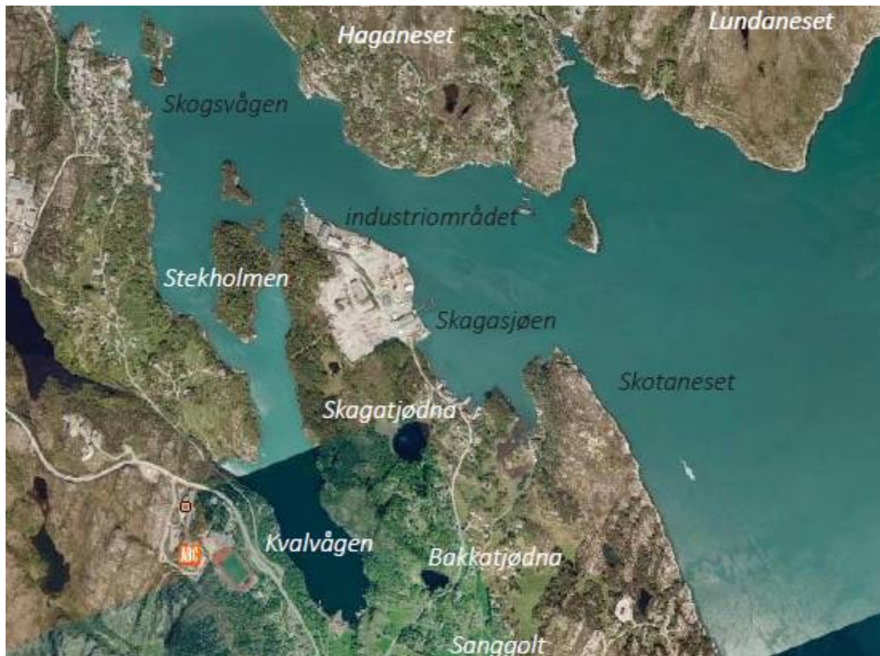
Over til venstre: Skaganeet ligg nord-aust i Sund kommune. Over til høgre: Utsnitt frå kommuneplanens arealdel. Nede: Satellittfoto av Skaganeet med stadnamn.