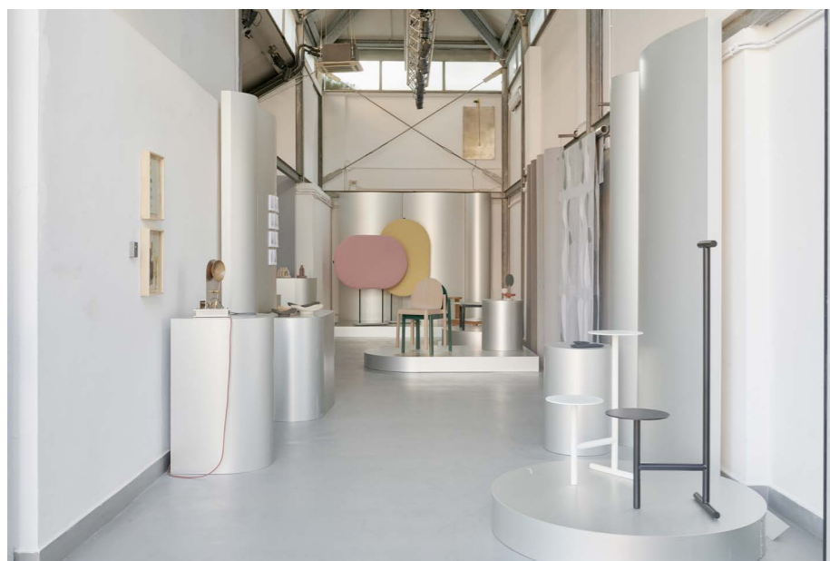
Bilde fra Norwegian Presence i Milano. Min stablestol "Frame" står i midten.