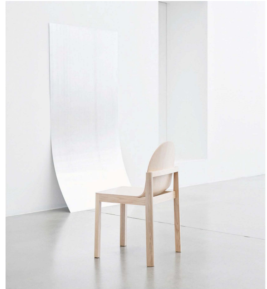
Stine Aas: Frame Chair – stol. Foto: Lasse Fløde & Torjus Berglid / Styling: Kirsten Visdal

Norske designere, håndverkere og produsenter stiller ut sammen under møbelmessen i Milano. Her er de fineste tingene.