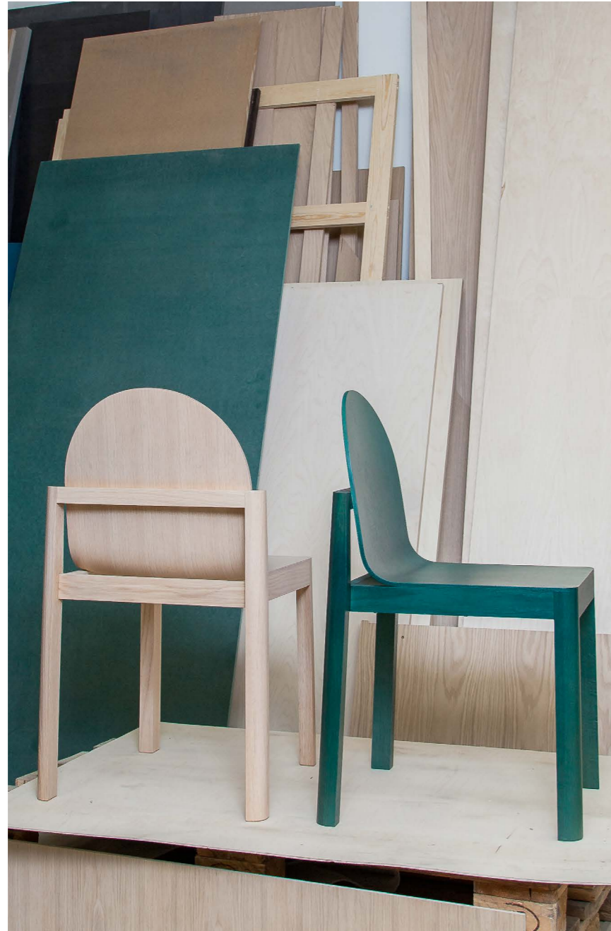
Bilder av den ferdige stolen.