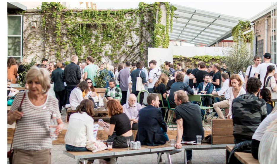
Bilder fra åpningen av Norwegian Presence i Milano.