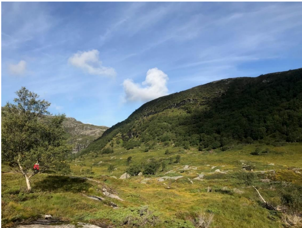
Figur 1: Bilde av område for planlagt adkomstvei.

Med det åpne landskapet og de karakteristiske fjellformasjonene erfarte NVE at Dalsbotnfjellet er et område godt egnet til friluftsliv og rekreasjon. Langs den rødmerkede stien passerte vi to punkter med loggbøker for besøkende, begge med tydelige spor etter gammel seterdrift. Dalsbotnfjellet er et åpent fjellplatå bestående av bart fjell og spredt myr, og toppene gir god utsikt mot alle himmelretninger.