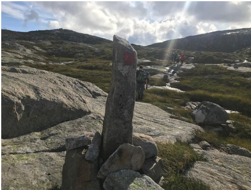
Figur 3: Bilde av rødmerking i planområde.

Underveis mottok vi innspill fra tiltakshaver, grunneiere/lokale og turlag. Ved Litlebotnen, vest for planområdet, ligger en hytte relativt nær planområdet. Hytta er åpen for alle som turmål og overnattingssted. Under befaringen ble det hevdet av fremmøtte at hytta vil bli vesentlig påvirket av et vindkraftverk på Dalsbotnfjellet.