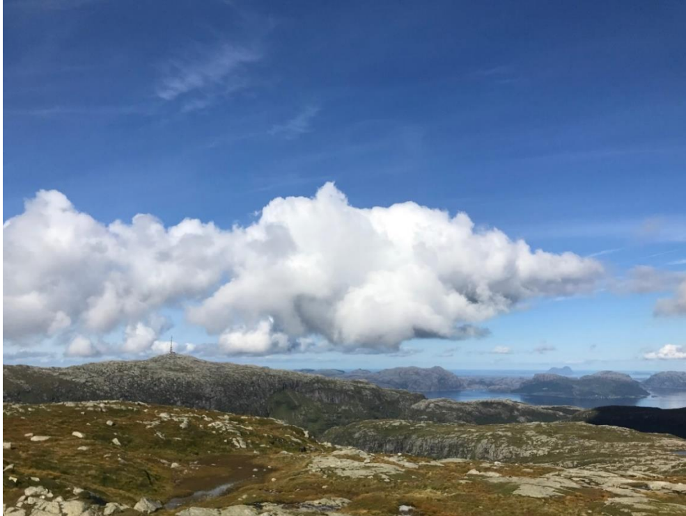
Figur 2: Bilde fra Storeggene (675 moh.) med utsikt mot nordvest. Gulen hovedsender på Brosviksåta vises til venstre i bildet.