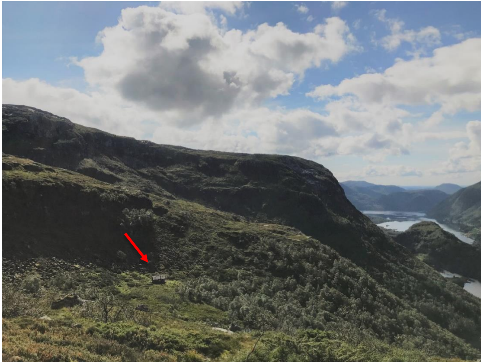
Figur 4: Bilde av hytte v/Litlebotnen. Én turbin er planlagt plassert på Storeggene, toppen til venstre i bildet. Tre turbiner er planlagt plassert i området bak fotografen.