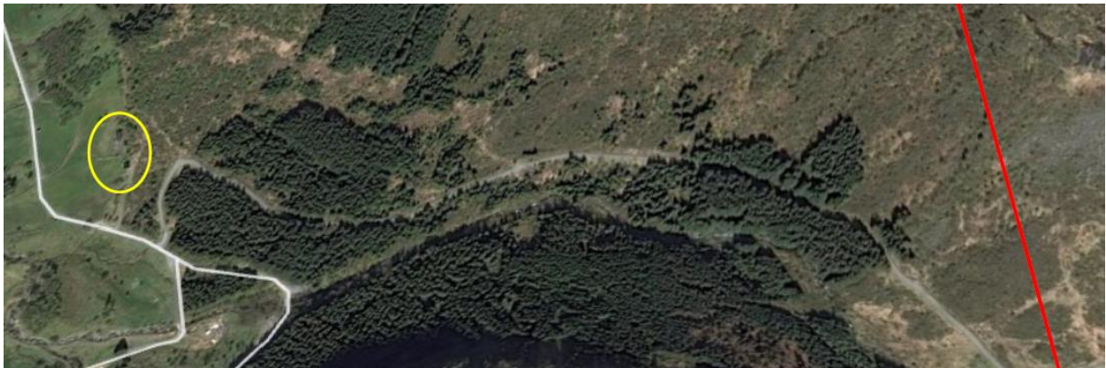
Figur 7: Waages eiendom er ringet med gul ring, kraftledningen vises med rød strek.

Når det gjelder forringelsen av turområder som klager selv bruker, gir en klage knyttet til allmenne interesser normalt sett ikke rettslig klageinteresse. NVE mener det ikke kommet frem noe i klagen som gjør at klager har klagerett som representant for allmenne interesser for friluftsliv. NVE påpeker imidlertid at tur- og idrettslag har klaget på det samme punktet, og at det dermed vil bli vurdert i klagesaken.