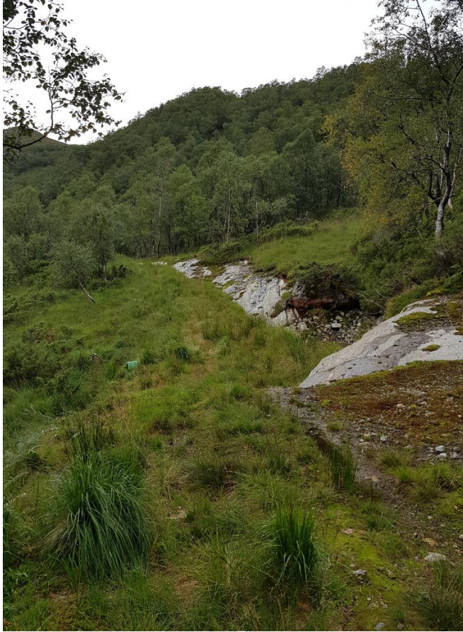
Figur 5: Bildet av traktorveien gjennom Myrdalen.