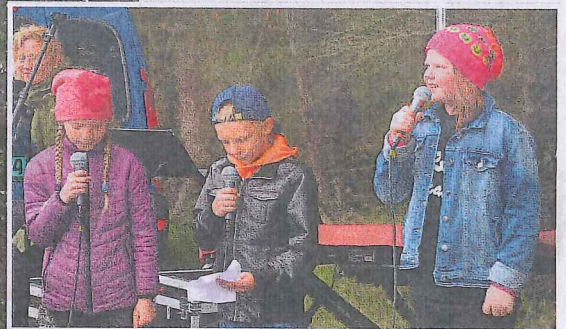
MODERNISERT: Ungene på Smøla har et nært forhold til Kulisteinen. Ungene på kulturskolen lærer seg teksten på Kulisteinen ved å rappe den!