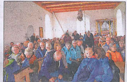
I KIRKA: Gjester fra hele landet fylte Edøy gamle kirke lørdag. Et ti års langt arbeid med å etablere en kystpilegrimsled fra Stavanger i sør til Trondheim i nord ble dermed avsluttet.