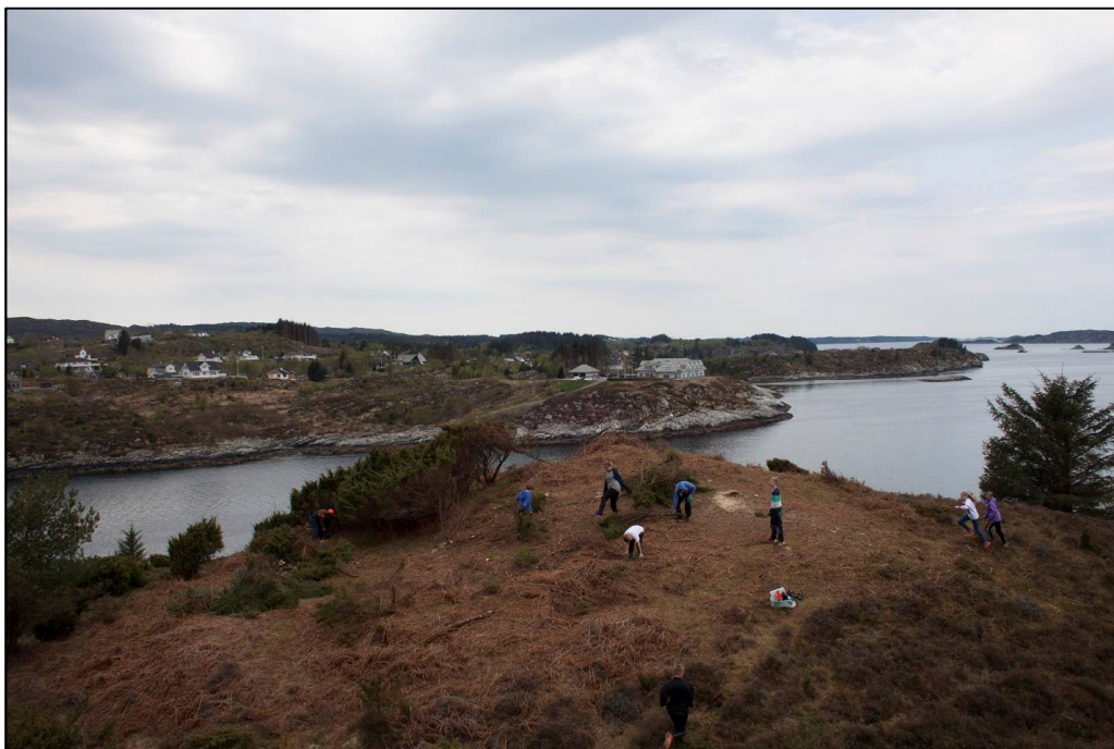
Elevar ved Kolbeinsvik skule i Austevoll gjer skjøtsel på gravrøys frå bronsealder.

Alle prosjekt treng ikkje vera omfattande. I april 2014 gjorde elevar ved Kolbeinsvik barneskule i Austevoll skjøtsel på ei gravrøys frå bronsealderen.