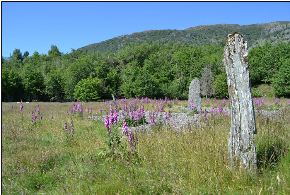
Strandgravfelt med bautasteinar på Årbakka, Tysnes.

Alle automatisk freda arkeologiske kulturminne har nasjonal verdi. Det lovfesta forvaltingsansvaret for desse kulturminna er lagt til fylkeskommunale og statlege styremakter, jf kulturminneloven.