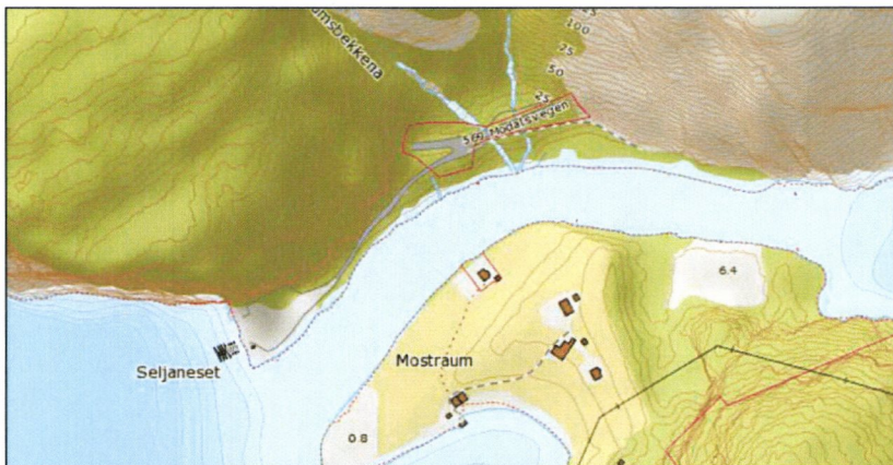
Figur 1: Kart over Mostraumen

Dette punktet vart ikkje innarbeidd i planen som vart sendt ut på høyring. Dette notatet vil legge fram kva endringar som er gjort i plandokumenta slik at de som høyringspart kan ta stilling til denne endringa. Grunna at storleiken på plandokumenta gjer at dei ikkje enkelt kan sendast per e-post så vonar me at dette notatet gir ein god nok omtale av endringa. Om de ønskjer dei reviderte plandokumenta tilsendt så skal de sjølvsgt få det.