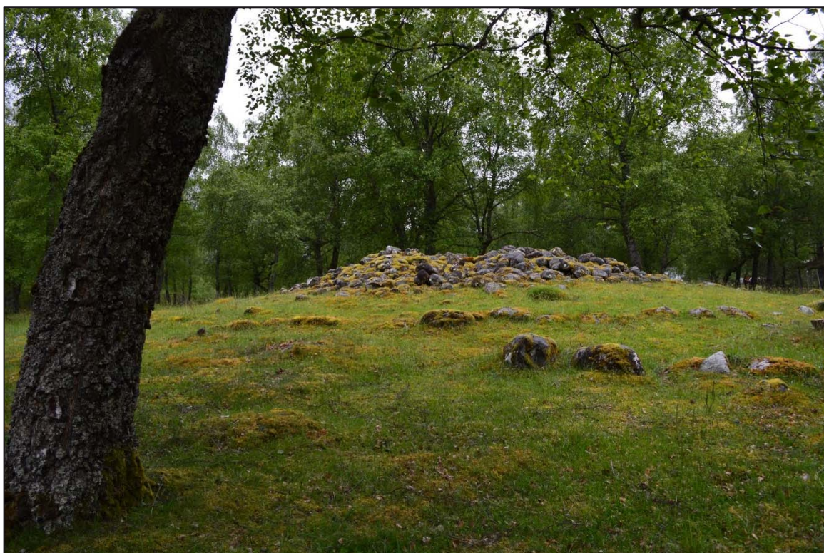
Ei av dei mest synlege gravrøysene etter skjøtsel.

Arbeidet med vegetasjonsskjøtsel har halde fram i 2018. Det vart gjennomført motorsagkurs på del av lokaliteten under oppsyn av fylkeskommunen. Det vart rydda mykje under kurset, og Eidfjord kommune sytte for opprydding av vegetasjonsskapp i etterkant. Nytt skilt er plassert på tilvist plass inne på lokaliteten, og saman med ny merking frå 2017 gir dette betre flyt i turiststraumen. I 2018 er det utarbeidd to mindre skilt som fortel om gravfeltet og gravene. Desse skal festast på gjerdet nær godt synlege gravminne. Benkar er framleis ikkje levert, men dette arbeidet vert følgt opp av Eidfjord kommune. Eidfjord kommune har i tillegg sikra at kulturløypa vil verte halde ved like, og har planar for vidare vedlikehald av arbeidet på lokaliteten.