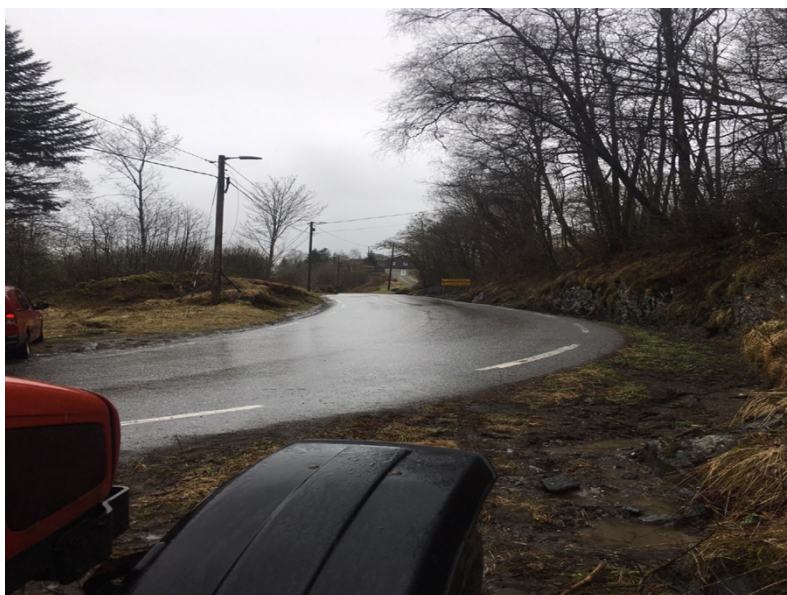
Figur 5: Klagar sitt bilete 3, med undertittel «Bilde 3. Bilde i den retning som vil bli brukt til av/påkjøring.».