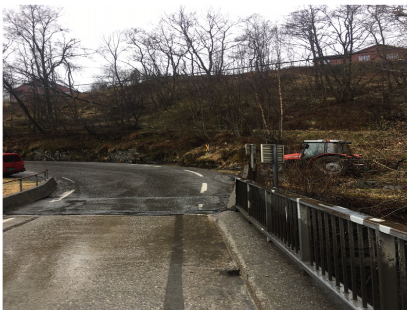
Figur 6: Klagar sitt bilete 4, med undertittel «Bilde 4. Veldig lett for andre trafikanter å se traktor som skal kjøre inn på vei.».