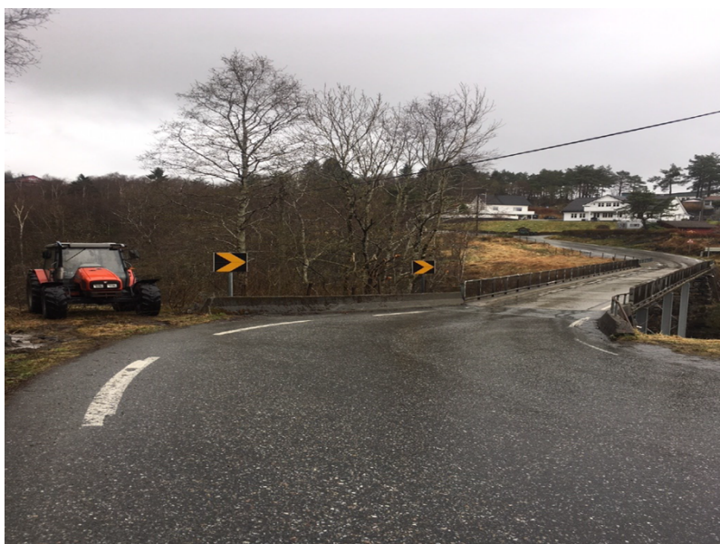
Figur 4: Klagar sitt bilete 2, med undertittel «Bilde 2. Meget god oversikt både til høyre og venstre.».

Bilde av avkjørsel 4 m bredde og trenger ikke ytterligere utbedringer for å komme seg på av vei. Vil bli satt opp grind for å eliminere muligheten for anna trafikk og kjøre feil.(en av bekymringene i avslaget.)