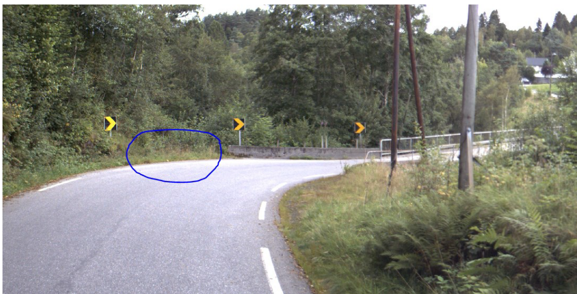
[Figur 3.] Vegbilette 2017 ved fv. 391 Leknes bru, omsøkt avkøyrslpunkt er markert.

I haldningsklasse 4 legg Rammeplanen til grunn at ein normalt sett kan få godkjenning til avkøyrsla under føresetnad at dei tekniske krava til utforming vert innfridd. Eit absolutt krav vi stiller er at det skal vere tilfredstillande sikt. På synfaring målte vi sikta og vi vurderer at våre krav til sikt kan verte innfridd, dersom avkøyrsla får riktig utforming. Andre krav vi normalt stiller til utforming er at avkøyrsla skal ha svingradius etter dimensjonerande køyretøy og slik at avkøyrsla vert mest mogleg vinkla 90° på fylkesvegen. Vanleg svingradius er 4 meter. Det er også eigne krav til lengdeprofilen, slik at avkøyrsla har fall frå fylkesvegen, og at tilkomstvegen ikkje kjem for bratt på fylkesvegen.