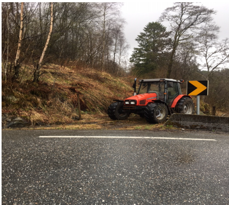
Figur 3: Klagar sitt bilete 1.

Bilde av avkjørsel 4 m bredde og trenger ikke ytterligere utbedringer for å komme seg på av vei. Vil bli satt opp grind for å eliminere muligheten for anna trafikk og kjøre feil.(en av bekymringene i avslaget.)