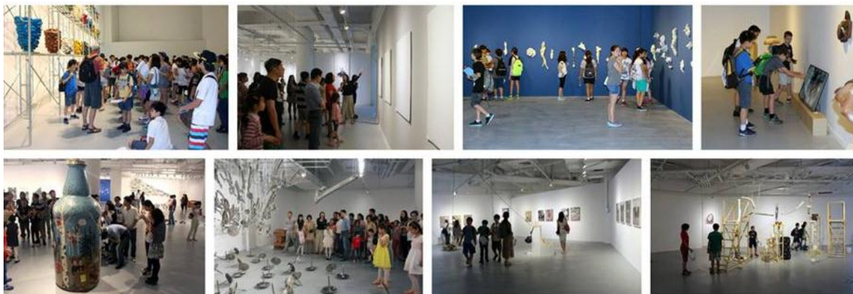
Bilder fra Beyond G(l)aze i Suzhou Jinji Lake Art Museum.

I 2013 gjennomførte Norwegian Crafts et grundig forprosjekt, med møter og atelierbesøk både i Kina og i Norge. I 2014 åpnet Beyond G(l)aze i Suzhou med 40 000 besøkende og god pressedeckning. Når utstillingen vises i Bergen i 2015, vil Norwegian Crafts sin internasjonale satsing også bli vist til et bredt norsk publikum, og være en unik mulighet publikum i regionen til å bli kjent med et viktig norsk-kinesisk samarbeid.