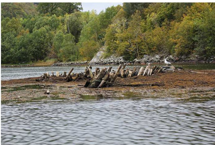
Figur 2 Trestruktur Svevågen.

Sjøbunnen i Svevågen besto av store mengder mudder, trolig på grunn av tilstrømming fra bekker i området. I Svevågen like vest for båthavnen var det en grunne med en tydelig trestruktur.