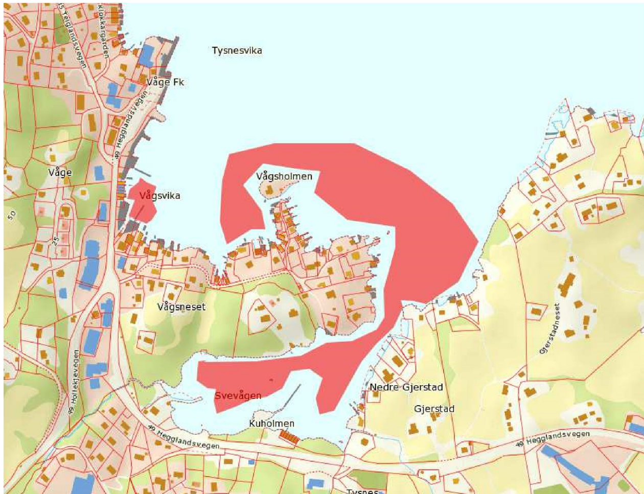
Figur 1 Kart over undersøkt område. Kart: Statkart