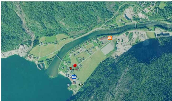
Kommunesenteret Mo i Modalen kommune. (Bryggjeslottet er ikkje med på bildet)

Fylkeskommunen må ta atterhald om alle byggeområde i planen til undersøkingsplikta etter § 9 i kulturminnelova er oppfylt. Dette gjeld både land og sjøområde.