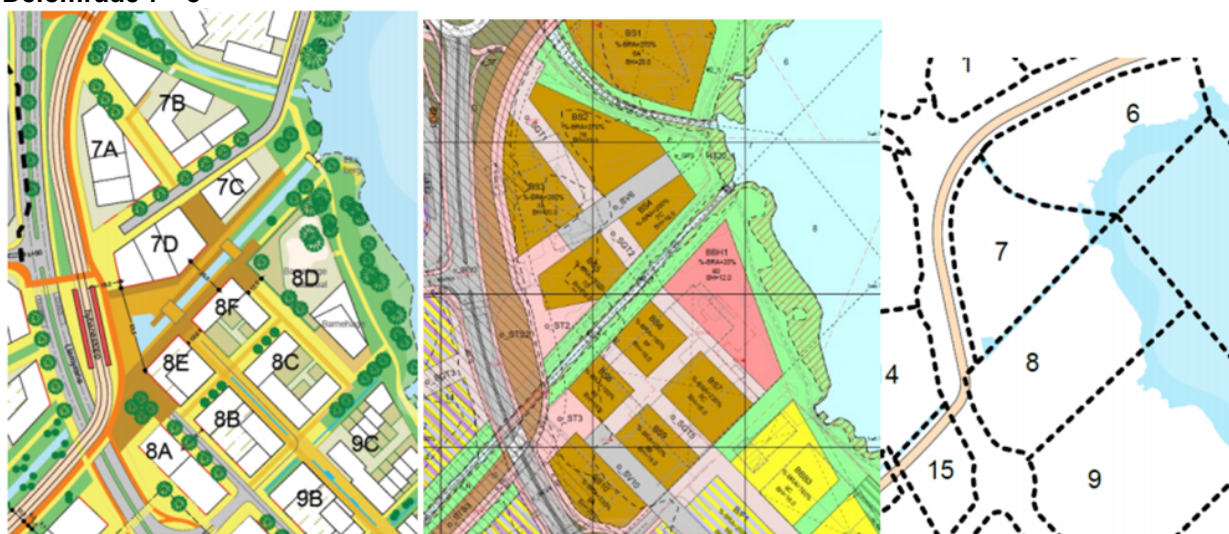
Figur 3 Utsnitt av illustrasjonsplan, plankart og oversikt over delområda i lokalsenteret i Alternativ 1