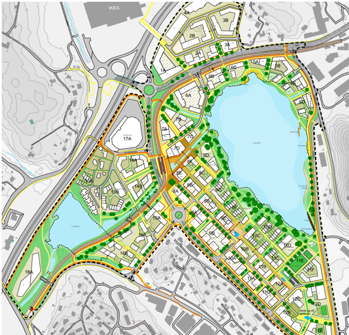
Figur 3 utsnitt av illustrasjonsplan for Alternativ 1.