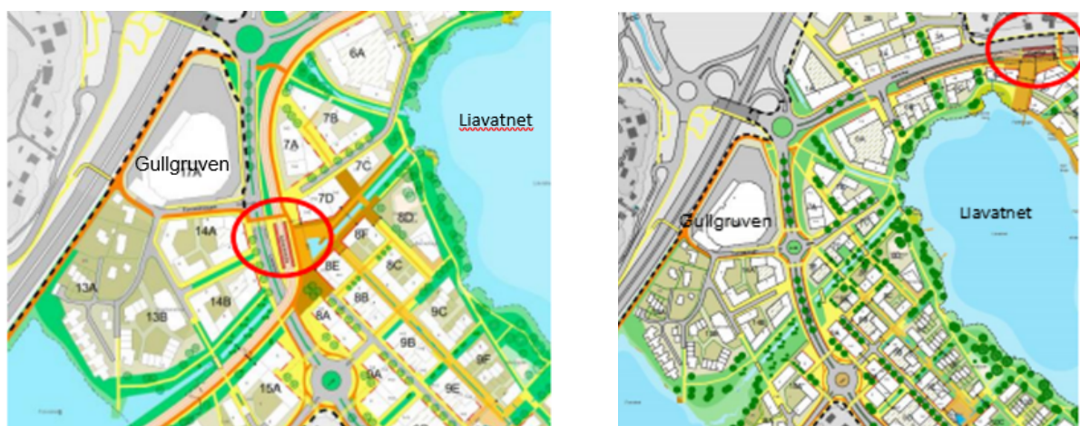
Figur 4 – viser ulike plasseringer av bybane stopp (rød sirkel) i de to planalternativa, nordvest i Alternativ 1 ved Liamyrane, t.v. og nordøst i planområdet i Alternativ 2, ved Åsamyrane t.h.