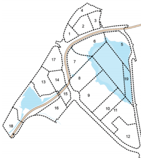
Figur 2 til høgre viser delområda i planforslag for Alternativ 1.