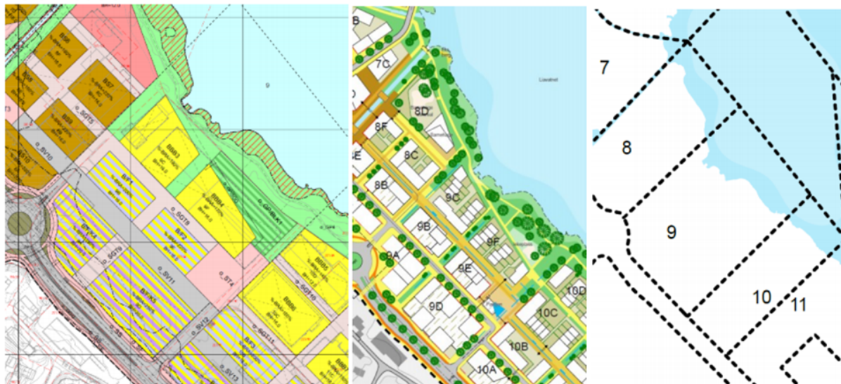
Figur 6 Utsnitt av plankart og illustrasjonsplan av delområde 9. I området er det opna for detaljhandel, det ligg tett på lokalsenteret. I det vidare planarbeidet bør det vurderast om det skal vere del av lokalsenteret, ved eventuelt å utvide sentrumsavgrønsing.