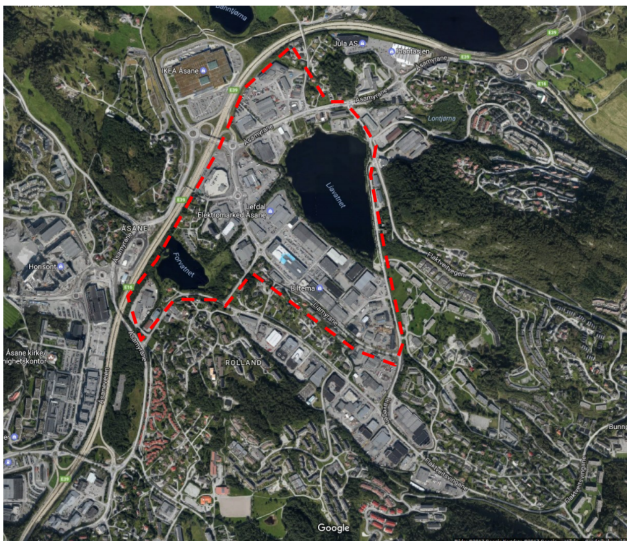
Figur 1 satellittfoto av planområdet, med omriss av planavgrensning

Når motsegn blir fremma må kommunen endre planen, som regel etter å ha drøfta problemstillingar og løysingar i møte med fylkeskommunen. Dei fleste motsegnene blir avklart i møte med kommunen, men dersom det ikkje blir semje vil planen gå til mekling hos Fylkesmannen i Hordaland.