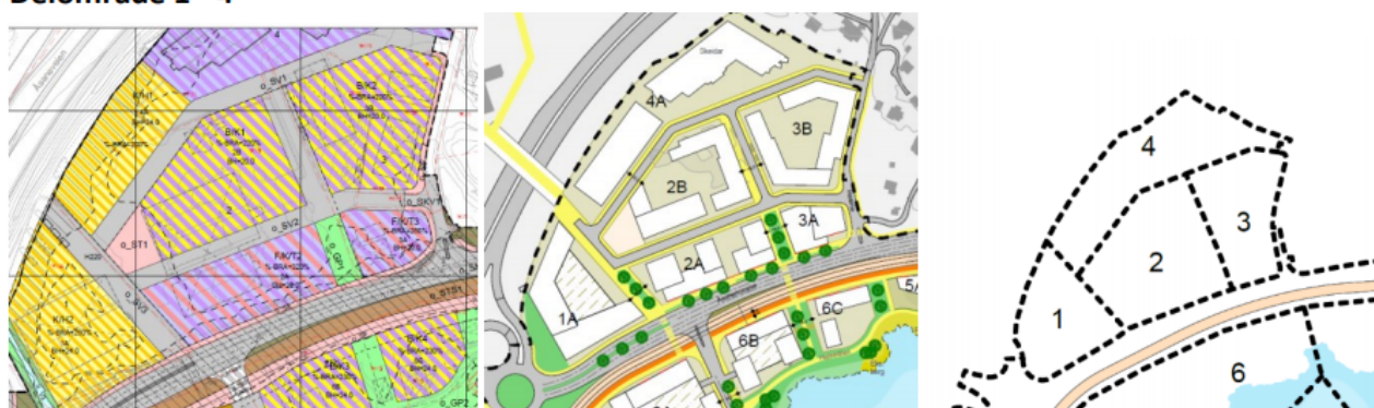
Figur 4 : plankart, illustrasjonsplan og oversikt over delområder 1-4 mellom vegen Åsamyrane, og E39, nord i planområdet. FKT2 og 3, er vist som kombinert føremål kontor, handel og tenester («rosa») eit føremål som heller bør leggas til sentrum.