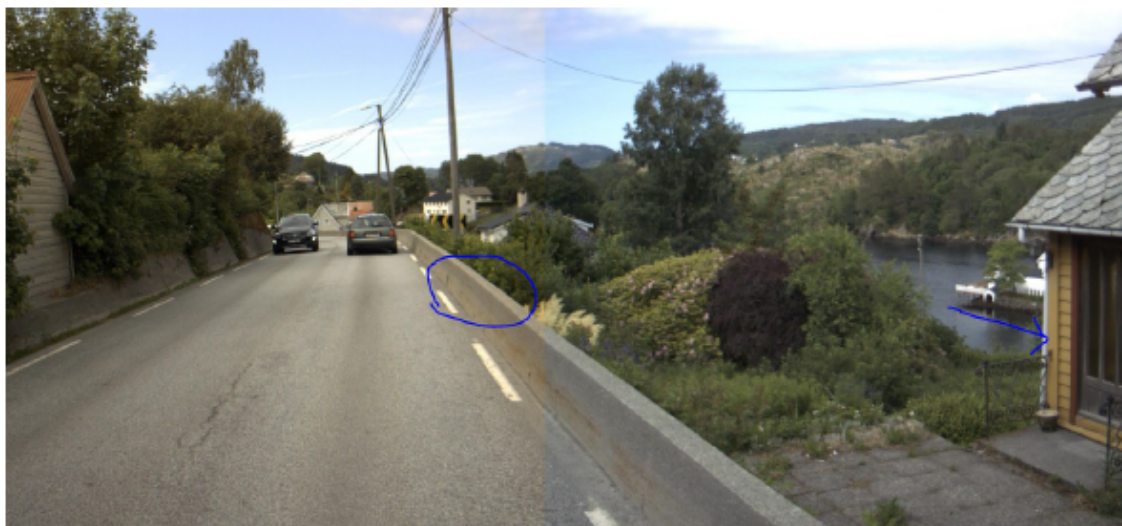
Vegbiletet 2018 som syner omtrentleg avkøyrsløp. Bustadhus til høgre i biletet.

Teikningane vi har mottatt viser ei prinsipiell utforming av tiltaket og det er difor vanskeleg å vurdere om dette lar seg gjennomføre i praksis. Etablering av avkøyrsløp og snu- og manøvreringsareal vil kreve store arealinngrep og er vanskeleg å gjennomføre. Det er heller ikkje vurdert korleis anleggsperioden skal gjennomførast. Tiltaket er ikkje avklara med Lindås kommune.