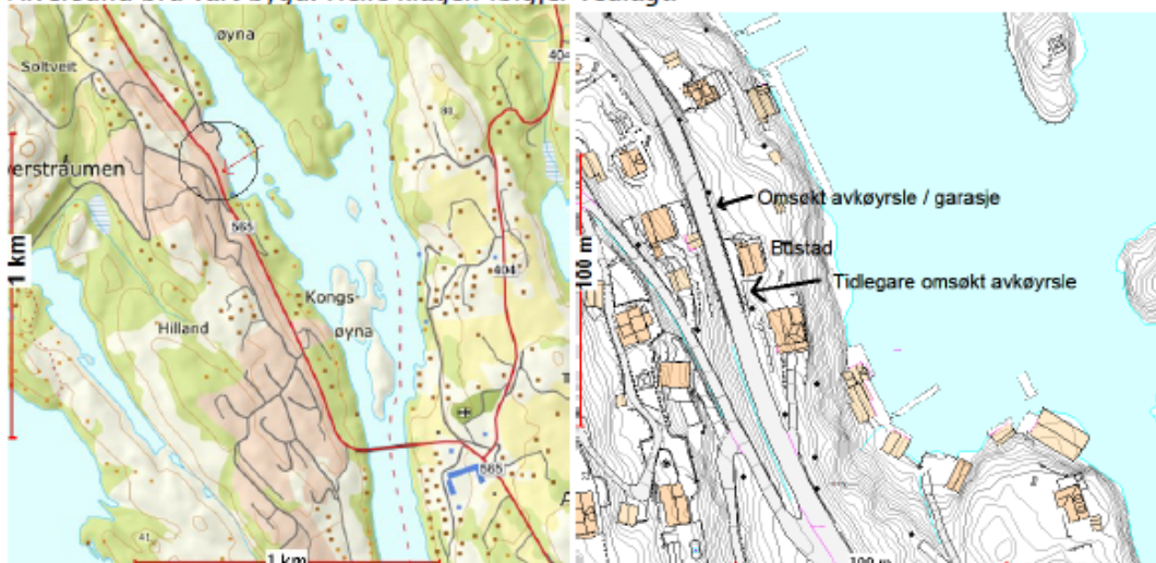
Oversiktskart (t.v.) og situasjonskart (t.v.). Omsøkt eigedom ligg langs fv. 565 ved Alverstrømmen, nord for Hilland i Lindås kommune.

Klagar har i dag ingen køyrbar avkøyrslse, og ingen moglegheit for stopp til å setje av passasjerar, eller parkeringsmoglegheit i nærleiken. Dette utgjer ein stor trafikkrisiko, særleg med fare for dødsulukker. Omsøkte tiltak vil avgrense denne risikoen. Klagar meiner vidare at det er mogleg å parkere og opparbeide sikker snu plass på eigen grunn. Vidare kan ein opparbeide tilstrekkeleg sikt. Klagar hevdar vidare at egedomen hadde avkøyrslse før den nye Alversund bru vart bygd. Heile klagen følgjer vedlagt.