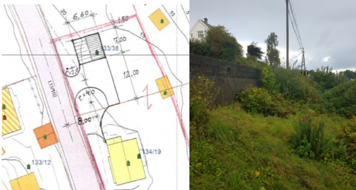
Situasjonskart vedlagt søknaden, som syner omsøkte avkøyrslø. Bilete t.h frå synfaring.

Søklar eig ei tomt med påståande eldre einebustad. Tomta har i dag gangtilkomst. Statens vegvesen av slo ein søknad om avkøyrslø 21.11.2017 til bustadeigedomen. Avslaget vart ikkje klagt på. Det er no levert ny søknad der avkøyrsla er flytta nord for bustadhuset, på ein tilstøytande eigedom som er på same eigarhand.