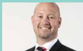
Justis- og beredskapsminister Anders Anundsen