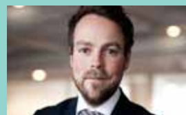
Kunnskapsminister Torbjørn Røe Isaksen

«Alle barn har rett til å si sin mening, og deres mening skal bli tatt på alvor.» art. 12