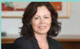
Barne-, likestillings- og inkluderingsminister Solveig Horne

Vi håper at du setter av dagen til å høre noen av de fremste forskere og fagfolk på området. Nærmere program vil være klart om kort tid.