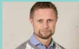
Helse- og omsorgsminister Bent Høie