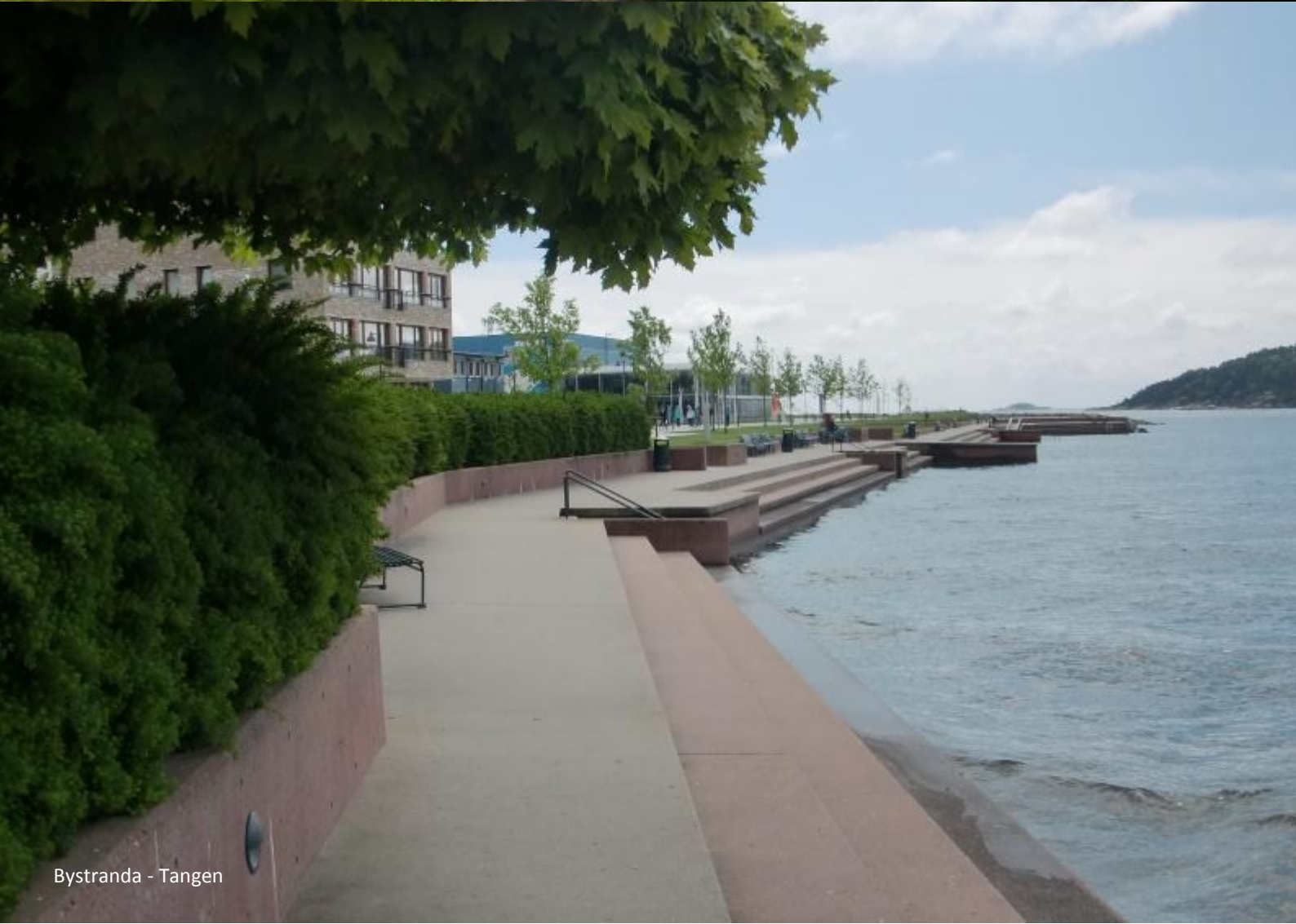
Bystranda - Tangen