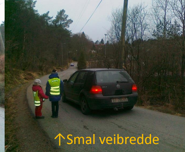
↑ Smal veibredde