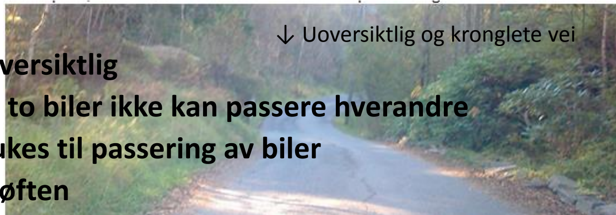
↓ Uoversiktlig og kronglete vei