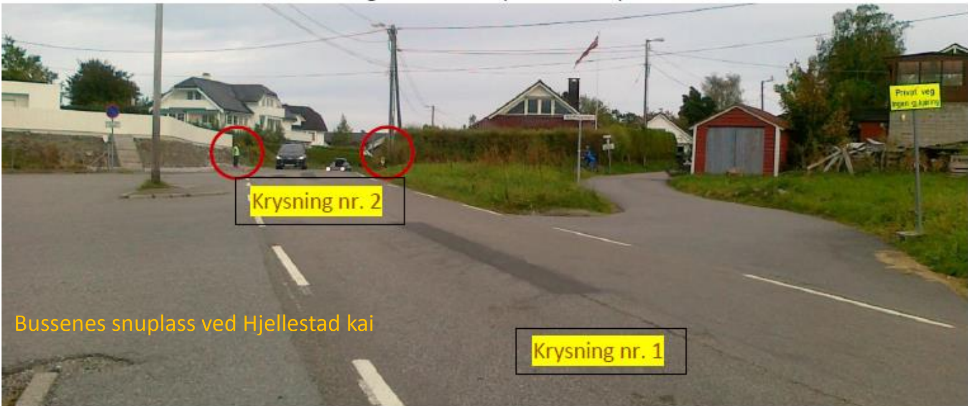
Bussenes snuplass ved Hjellestad kai