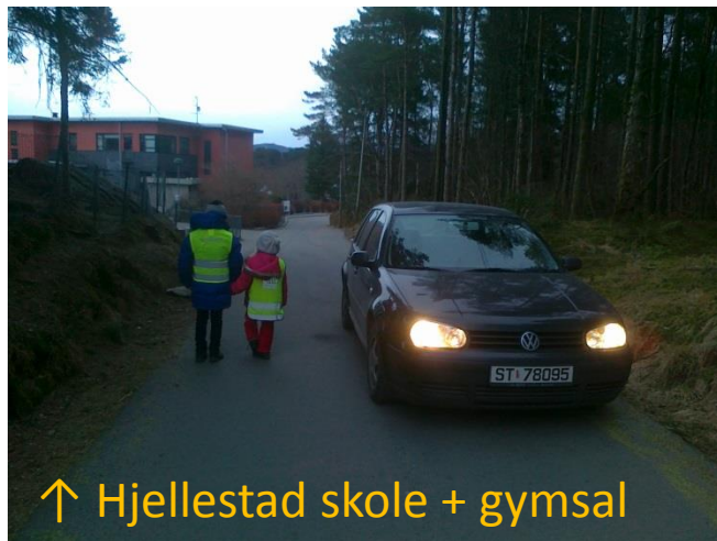
↑ Hjellestad skole + gymsal