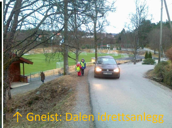
↑ Gneist: Dalen idrettsanlegg