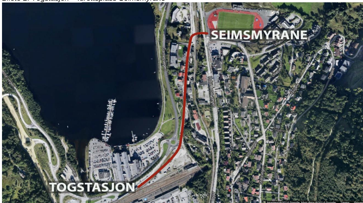
Bilete 2: Togstasjon – Idrettsplass Seimsmyrane

Offentleg kommunikasjon er godt utbygd både med tanke på tog og buss for å komme seg til og frå dei sentrale delane av indre Arna frå nærliggande områder og kommunar. Dette gjeld i stor grad for dei områda skulane i dag rekrutterer elevar, først og fremst; Bergen, Vaksdal, Osterøy og Samnanger. I så måte er dagens to vidaregåande skular Arna ikkje særleg gunstig plassert. Frå Garnes vgs og Arna vgs er det hhv 3.5 km og 3,0 km til stasjonsområdet. Med tanke på plassering er det avgjerande at eit nytt vgs tilbud i Arna vert plassert i kort gåavstand til togstasjon og bussterminal. Skulen må ha tilgang på gode kollektive kommunikasjonar slik at den er lett å nå frå dei ulike områda skulen skal dekke. Per no er Seimsmyrane det nærmaste aktuelle alternativet.