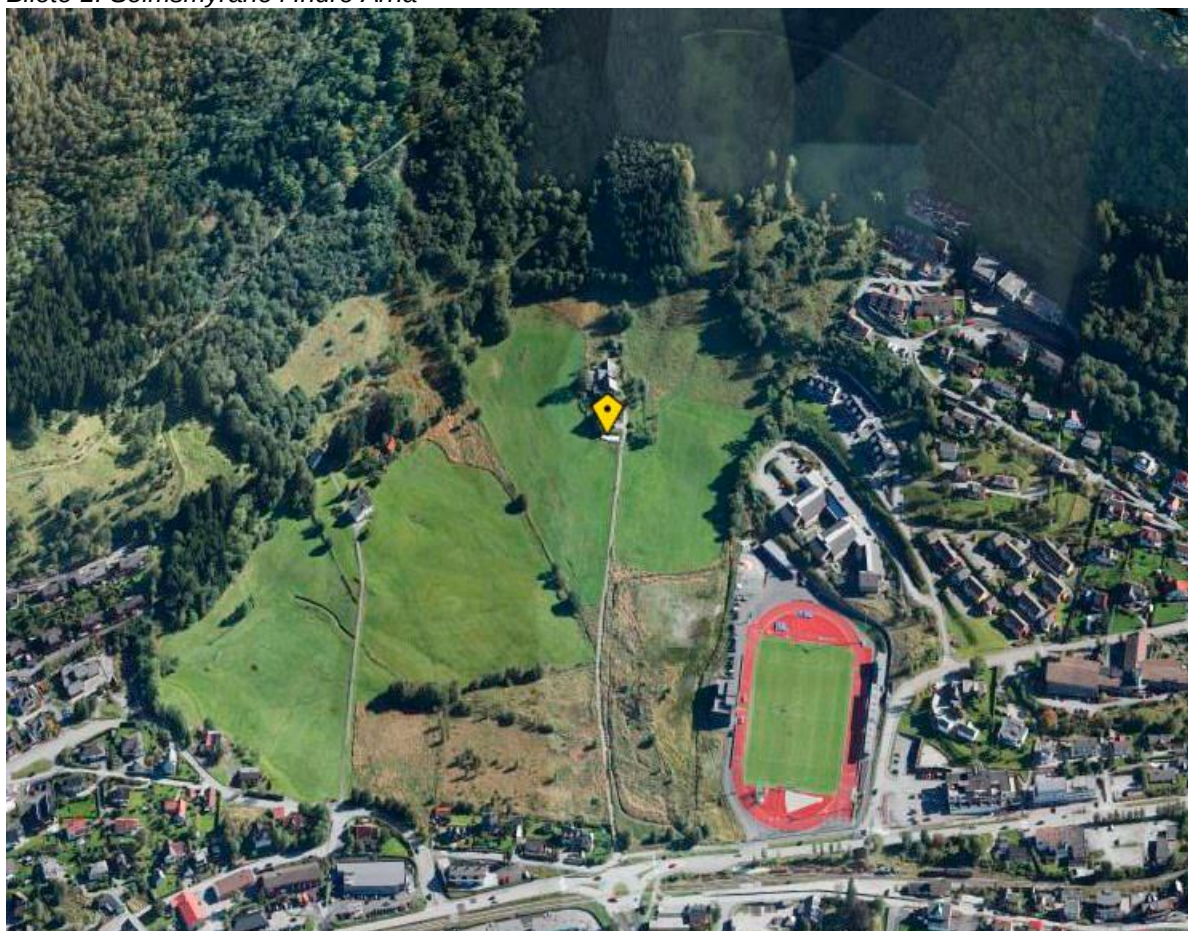
Bilete 1: Seimsmyrane i Indre Arna

Fylkestinget sitt vedtak seier at det vidaregåande skuletilbodet i Arna skal samlast i Arna vgs sine lokale samstundes som vedtatt fagtilbod ikkje vil få plass i skulen sine noverande lokalar. Dette gjer at det inntil vidare er to skuler i Arna. Når det gjeld bygging av ny skule ligg det ikkje føre noko vedtak på dette og det er heller ikkje sett av pengar i HFK sin økonomiplan fram mot 2019. Ei realisering av nybygg til vgs i Arna vil difor mest sannsynleg ligge noko fram i tid.