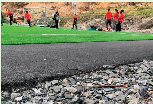
Stemmemyren i Bergen er det første kunstgrasanlegget der ein har kartlagt mikroplast i nærområdet.

Prosjektet fekk tre millionar kroner i støtte frå RFF Vestlandet i 2018.