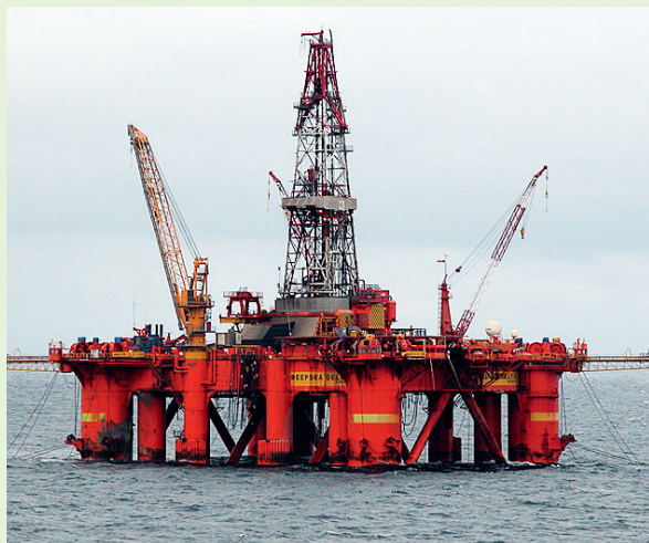
Med stadig meir avanserte bore- og kontrollsystem, vert boreriggjar offshore også meir utsette for cyberangrep. Dette er boreplattforma «Deep Sea Delta» i Nordsjøen.

Boreriggane offshore vert stadig meir avanserte. Mange komponentar er i realiteten små datamaskinar med sensorar og sendarar – gjerne kontinuerleg kopla på nett. Dermed aukar også risikoen for cyberangrep frå datasno-kar, terroristar eller regimer som vil demonstrere makt. Og får ein virus i naudsystema på ein borerigg, der ein arbeider under enormt trykk og har lite tid til å reagere, kan konsekvensane bli katastrofale.