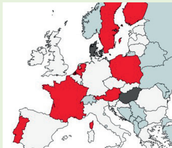
Trender i desentralisering av forskings- og utviklingspolitikken (raud = auka desentralisering; mørkegrå = auka sentralisering; kvit = inga endring).

fonda i Noreg. Den er ei ajourføring av ein tilsvarande studie gjennomført på oppdrag frå Forskningsrådet og fonda i 2012.