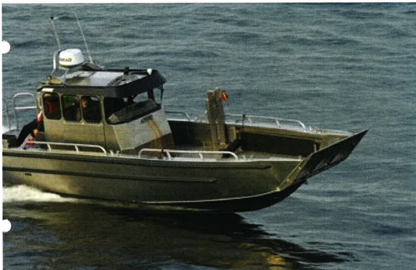
( https://smartmarine.no/media/djcatalog2/images/item/3/arronet-27-cci-work_f.jpg )

Arronet (/produkter/43-arronet) Arronet 27 CCI Work