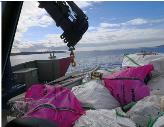
Full skipslast frå Austerøy, Tysvær