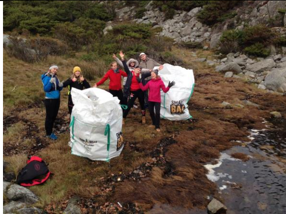
Folkehøyskoleelever rydder Austerøy, Tysvær