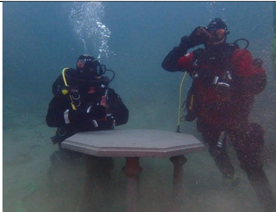
Bunnrydding i Smedasundet, Haugesund