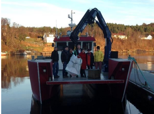
Fra pressekonferanse, Lindøy, Karmøy