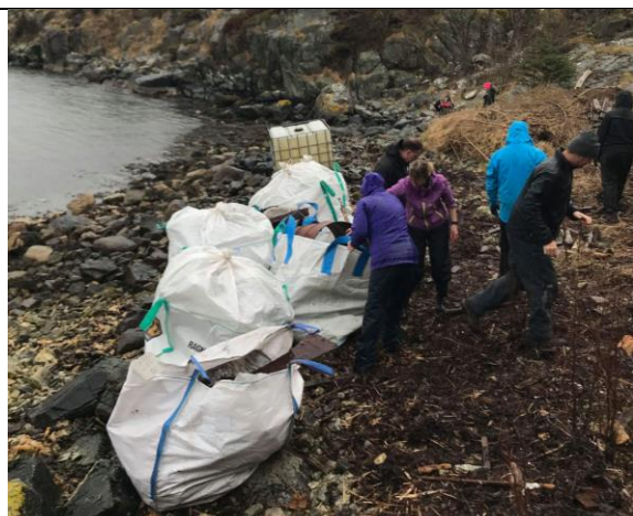
Strandrydding på Ytreland, Karmøy