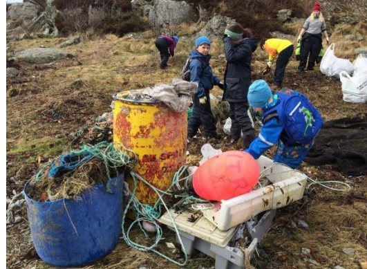
Ung dugnadsgjeng fra Ytreland, Karmøy