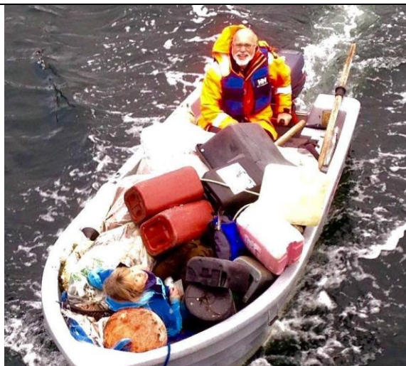
Fantastisk innsats av frivillige..