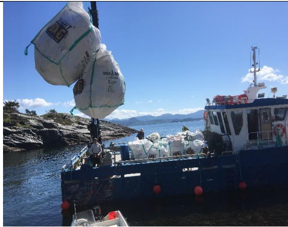
Samarbeid med bedrift, Halsnøy, Kvinnherad