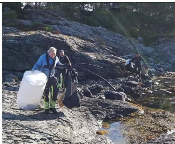
Plastsøppel frå Snik, Karmøy