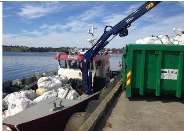
Tømming av last på Husøy, Karmøy