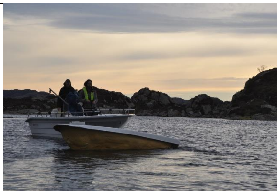
Kassert fritidsbåt på Sauøy, Karmøy