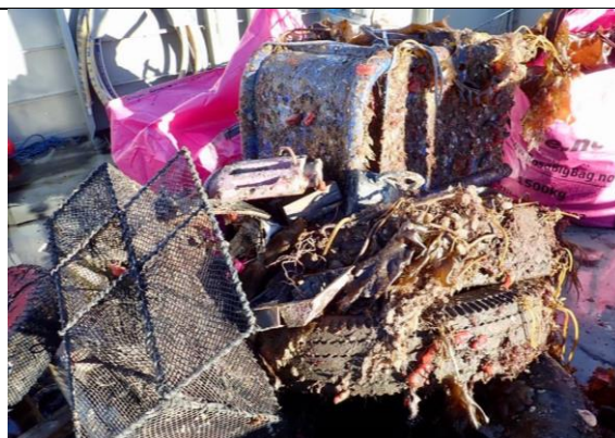
Søppel frå bunnrydding, Haugesund