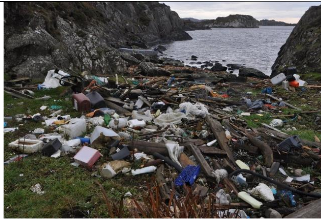
Her er det mye å ta fatt i..