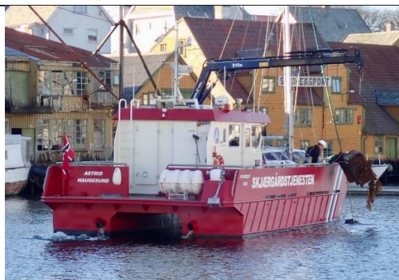
M/S Astrid i Aware Smedasundet, Haugesund