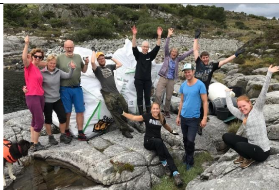
Strandrydding på Fosen, Karmøy