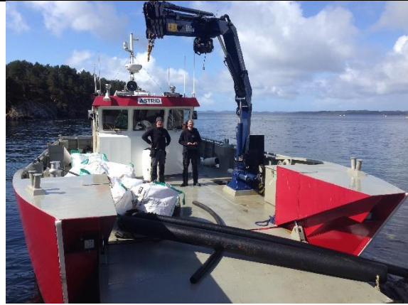
Henting av strandsøppel i Sveio