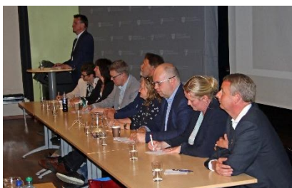
Politikarpanelet på møtet i Sunnhordland.