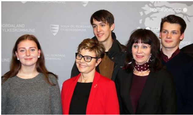
Kvam ungdomsråd var oppteken av ungdomsbillett og helsesyster. Her på møtet i Bergen med dei to fylkesordførarane.