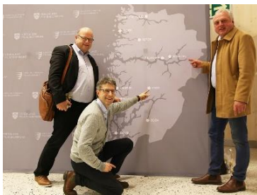
Hardangerrådet, Voss kommune og Sogn regionråd har allereie begynt samarbeidet om Indre Vestland. Her frå dialogmøtet på Voss.