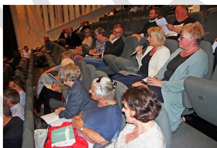
Innspel frå salen under møtet i Sunnhordland.