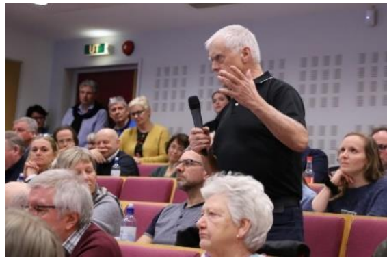
Mange gode innspel frå dei framtmøtte. Her frå dialogmøtet i Førde.