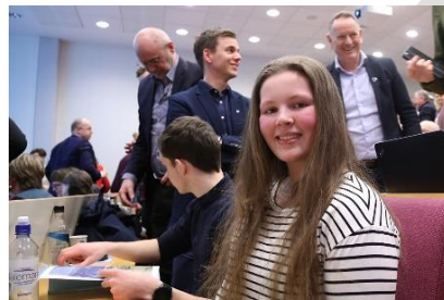
Leiar for ungdomspolitisk utval i Sogn og Fjordane fortalde kva som er viktig for ungdom i fylket. Her frå dialogmøtet i Førde.