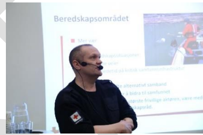
Odda Røde Kors, her ved administrativ leiar, sette fokus på viktigheita av frivillig innsats. Her frå dialogmøtet på Voss.