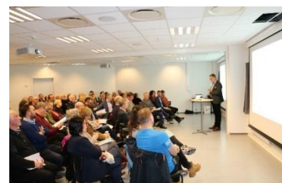
Dialogmøte i Sløvåg.