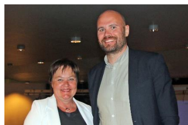
Ordførar i Etne og Stord på dialogmøtet i Sunnhordland.