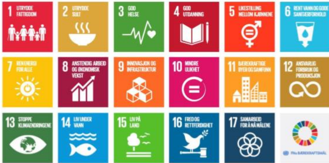
FN sine bærekraftsmål og hovudutfordringar for Vestland fylke