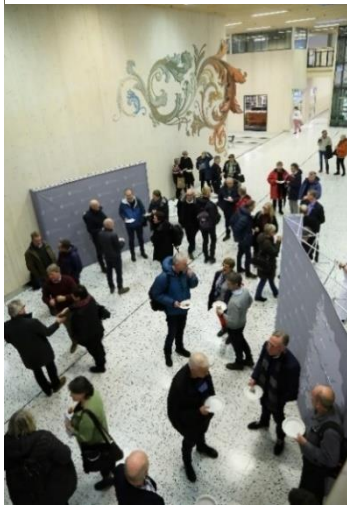
Elevane ved Voss vidaregåande skule, Skulestadmo, hadde laga smakfull mat til dei framtmøtte.