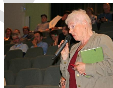
Frå dialogmøtet i Sunnhordland.