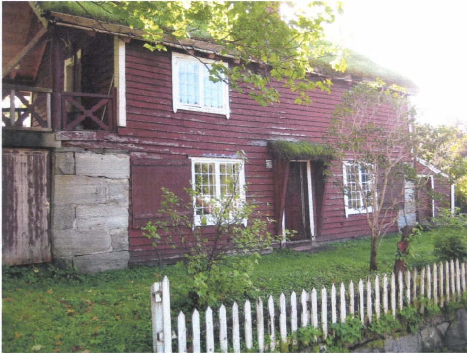
Rothstova, nordvegg, før igangsettelse