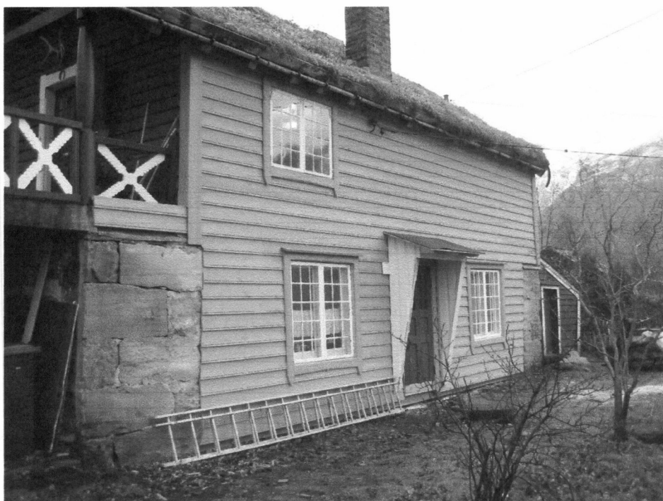
Ferdig istandsatt, isolert og kledd nordvegg. Gamle vinduer og dør beholdt.