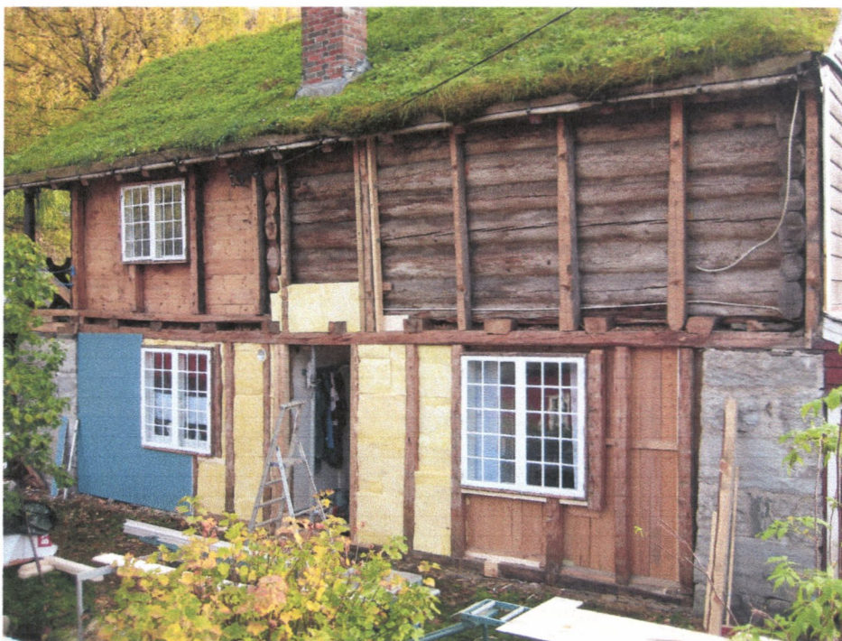
Nordvegg, underveis i oppbygging.