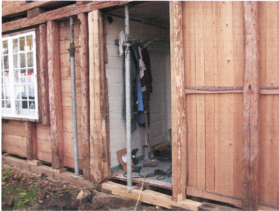
Eksempel på sikring og utskifting