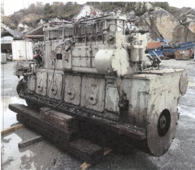
Wickmann 4 AC hovedmotor

I samarbeid med Riksantikvaren har vi overtatt diverse motorar og delar frå gamle M/F Rosendal (M/F VESTGAR frå 1979) Ferja blei hogd i Fredrikshavn i Danmark i august, og vi var snarrådig og sikra oss to LISTER hjelpemotorar og ein WICKMANN 4 AC hovedmotor. Vi overtok også den gamle elektriske tavla og ein luftkompressor og litt deler. Dette er maskindelar som vil koma godt med i framtida, då det begynnar å blir meir og meir vanskeleg med å få tak i slike i dag.