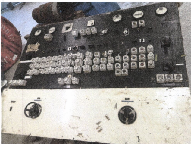
Den elektriske hovedtavla