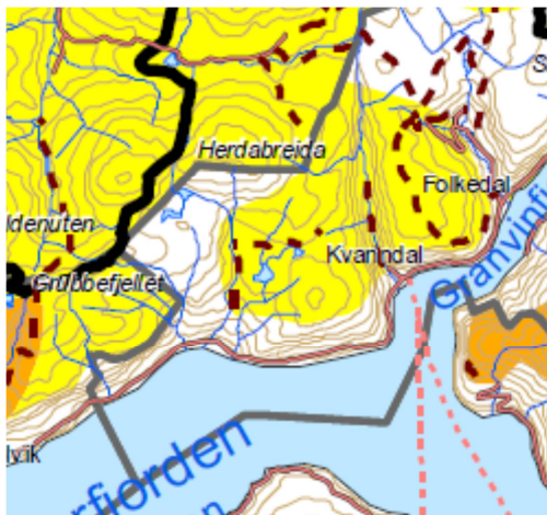
Figur 3 Utsnitt av verdikart "friluftsliv" frå Fylkesdelplanen.

Øvre del av prosjektområdet ligg i friluftsområdet Kalvbakkehøgdi / Gråfjell, eit registrert friluftsområde med noko verdi. Verdiane er knytte til opplevingskvalitetane i landskapet og at det er lite inngrep. Området er vurdert å ha lite bruk, vere lite tilgjengeleg eller eigna som friluftsområde.