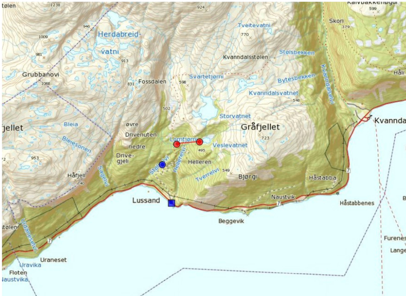
Figur 1 Raud strek syner overføring frå Hedlarelvi til Stølselvi. Blå sirkel er inntaket i Stølselvi. Blå firkant er kraftstasjon og utløp ved Hardangerfjorden.

Kraftverket vil nytte fallet i Stølselvi og Hedlarelvi til ein årleg produksjon på 5 GWh. Det vil vere ei overføring i nedgravd røyr på 250 meter frå kote 430 i Hedlarelvi til Lomtjørne ved kote 383 som renn ut i Stølselvi. Røyret vil leggjast langs eksisterande traktorveg. Vatnet vil så renne ned Stølselvi til kote 149 der det er inntak. Det vil etablerast om lag 10 meter lang betongdam ved inntak i både overføring og hovudinntak. Frå hovudinntaket vil vatnet gå i nedgravd vassveg, delvis langs skogsvegen, fram til kraftstasjonen ved fjorden. Totalt vil 450 meter av Stølselvi og 1200 meter av Hedlarelvi få endra vassføring som følgje av tiltaket. Minstevassføringa i Stølselvi vil vere 0,05 m 3 /s sommar og 0,012 m 3 /s vinter. I Hedlarelvi vil minstevassføringa vere 0,5 m 3 /s sommar og 0,2 m 3 /s vinter. Prosjektet har ein venta kostnad på 20 mill. kr. som gir ein utbyggingspris på 3,95 kr/kWh. Det er i dag ikkje nettkapasitet til å ta i mot krafta frå Lussand kraftverk.