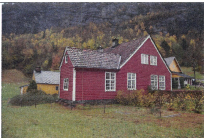
Håvard Parr © Riksantikvaren