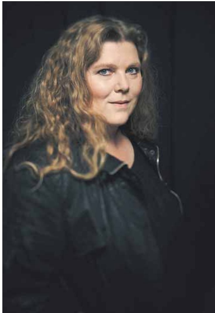
FANTASYDRONNING: Den danske forfatteren Lene Kaaberbøl har hatt stor suksess med fantasy-bøkene sine for ungdom både i Noreg og i mange andre land.