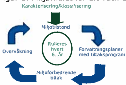
Figur 2. Planhjulet for gjennomføring etter vassforskrifta.