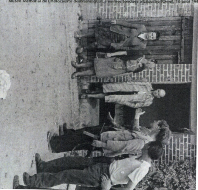
Musée Mémorial de l'Holocauste de Washington, Femmes tondues à Erpuché (Orne), 16 août 1944