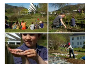
Hva om vi dyrket 1% selv...?

Bærekraftige liv sprer seg til hele landet og er en del av det internasjonale Transition nettverket. Hvordan kan vi ta store problemstillinger som virker uoverstigelige og snu dem til muligheter? Hvordan kan vi gå fra «protest til fest»? Hvordan kan vi nå et positivt vippepunkt i møte med nødvendige endringsprosesser?