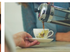
Det enkle er ofte det beste...