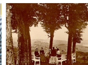
Familien Grieg i Lystgårdens vakre bage