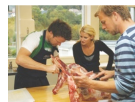
Gamle kurs i en ny drakt; Husmorskolen 2.o.

Vi tilrettelegger praktiske kurs og opplevelser, basert på mange års erfaring med gjør-det-sammen-utprøving. Sylting, safting, partering, kom i gang med kjøkkenhage, vedhogst, redesign, juleverksted, sykkelreparasjon, økokjøring, spiselig grøftemat, geriljaplanting, visjonsverksted, byttefest osv, osv.