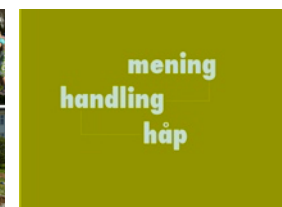
Mening for enkeltmennesket. Handling i fellesskapet. Håp for helbeten.