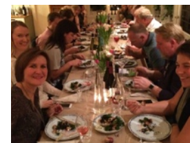
Et langbord med god mat og gode tema slår det meste.