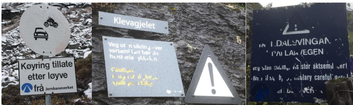
Skilt som skal bytast ut. Forbudsskilt ved Storurdi til venstre, varselkilt ved Klevagjelet i midten og varselkilt ved Myrdalsvingane til høgre.