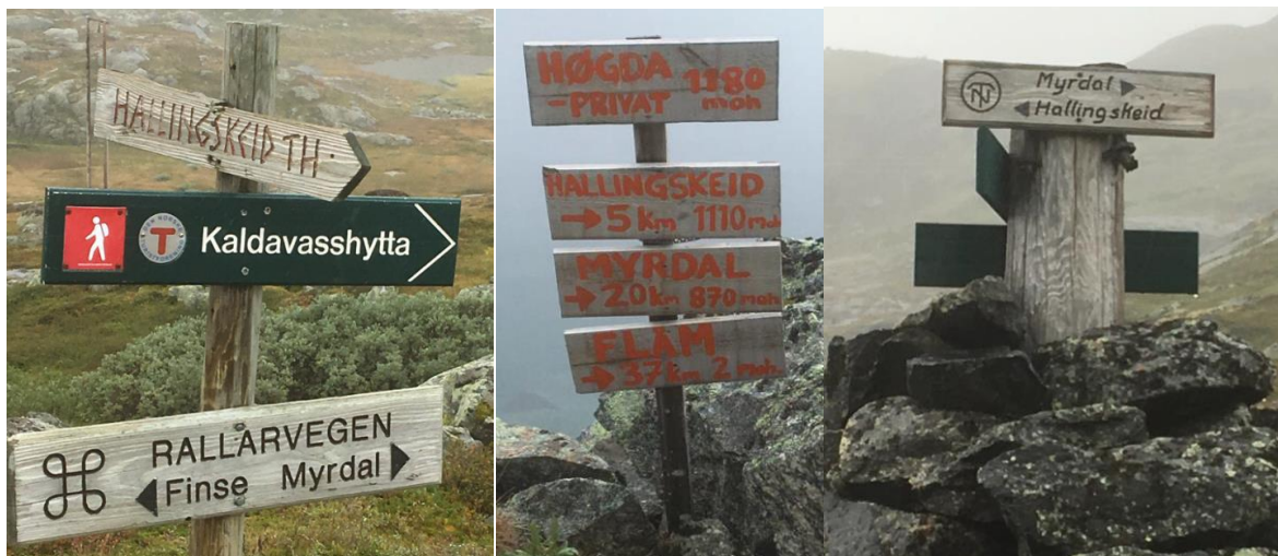
Døme på eksisterande retnings-/avstandsskilt langsmed traséen, strekninga Finse-Flåm.

Hausten 2017 vart det gjennomført ein ringerunde til instansar og føretak med interesse i/for Rallarvegen, der eitt av spørsmåla var: dersom interessenten kunne velje ein ting som han/ho ville fått gjort eller endra på i samband med Rallarvegen, kva skulle det vere? Svaret på dette spørsmålet var i stor grad at ein ønskte å få satt opp skilt som viste avstandane på strekninga generelt, og avstand til næraste rasteplass, overnattingsstad, toalett og liknande. Slike skilt skal difor prioriterast i formidlingsarbeidet. I tillegg skal varsel-/forbudsskilt bytast ut på fire (fem) stader. Skilta skal vere på plass til sesongen 2018.