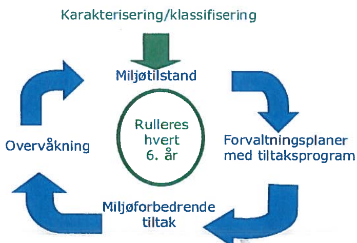
Figur 2. Planhjulet for gjennomføring etter vassforskrifta.

Arbeidet etter vassforskrifta vil fortsetje å kreve eit stort engasjement frå kommunane og staten, også etter at vassforvaltnings- og tiltaksplanar er vedtatt. Vassområdeutvalet skal sikre eigarkommunane si medverking og forplikting, samt fagleg forankring og kontinuitet i arbeidet mot god kjemisk og økologisk vasskvalitet. Vassområdeutvalet skal og koordinere det vidare tiltaksarbeidet og vere ein arena for kompetanseinnhenting, erfaringsinnhenting og samhandling.