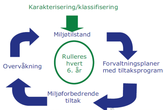
Figur 2. Planhjulet for gjennomføring etter vassforskrifta.