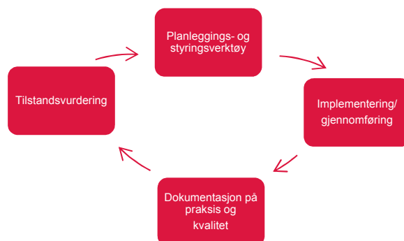
Figur: kvalitetssikring som ein syklus

Planleggings- og styringsverktøy definerer m.a. innhald og framdrift i fagskuleutdanningane. Dei mest sentrale dokument er her a) Fagplan (plan for utdanninga sitt faglege innhald og b) Plan for gjennomføringa av utdanninga (tid/stad). Andre dokument som kan ha betydning for fagskuleutdanning er nasjonale og regionale strategiplanar samt utviklingsplanar for den einkilde skule.