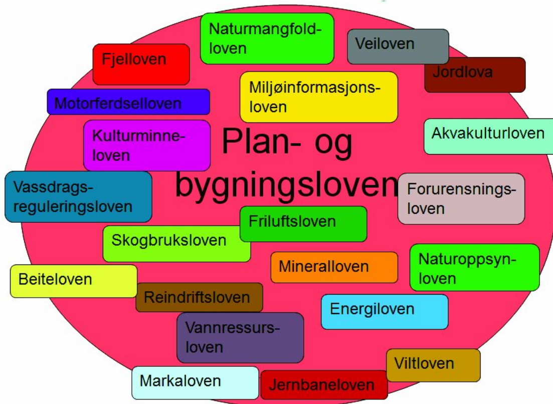
Figur 1: I tillegg til plan- og bygningsloven har en rekke lover betydning for utmarksforvaltningen. Listen er ikke uttømmende.

Planlegging etter plan- og bygningsloven er ment som en felles arena for avveining av ulike interesser knyttet til arealbruk. Det er flere forhold som begrenser planleggingens rolle som styringsmiddel i utmarksforvaltningen. Mens enkelte sektorlover er fullt ut integrert i plansystemet, slik som veiloven, gjelder andre forvaltningssystemer parallelt med, eller ved siden av, plansystemet, f.eks. energisektoren. I tillegg vil forslag om nye tiltak kunne endre forutsetningene i vedtatte planer. Gjennom dispensasjoner eller omregulering kan kommunene godkjenne tiltak i strid med arealformålet i eksisterende planer. Planer kan dermed bli oppfattet og praktisert som et utgangspunkt for, snarere enn et resultat av, forhandlinger.