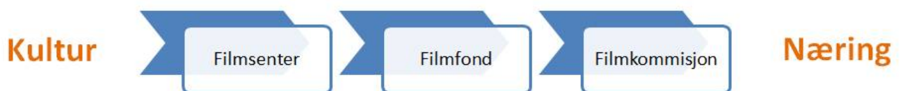
Figur 3 Dei regionale filminstitusjonane si plassering langs aksene kultur versus næring

Problemet er at dei regionale institusjonane er splitta i to sett, eitt for Rogaland og eitt for dei resterande vestlandsfylka. Kvar for seg fungerer institusjonane godt, men dei samla ressursane som er til rådvelde, som i seg sjølv er utilstrekkelege, vert ikkje optimalt utnytte når dei vert forvalta av to parallelle strukturar. Ein samordning av dei regionale strukturane er derfor ein føresetnad for å bryte dagens mønster og det første steget mot ein regional filmstrategi.