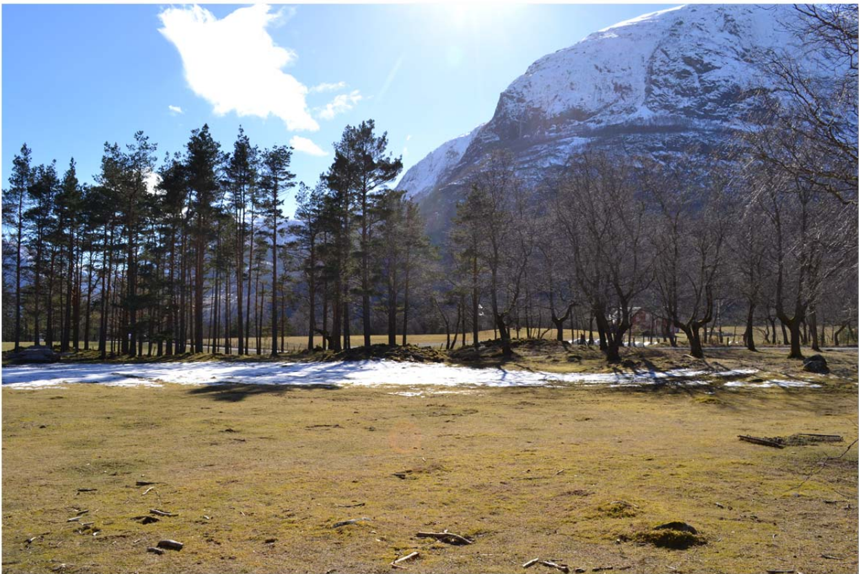
25.03.2014 – Samarbeid med Eidfjord kommune om sjøtsel og tillrettelegging gravfelt på Hæreidterrassen