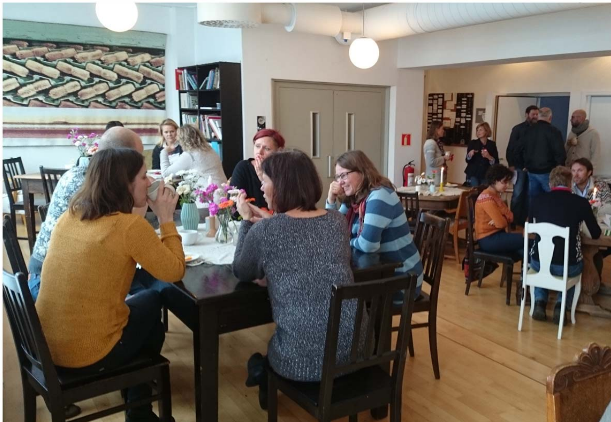
29.10.2014 - Kulturminneplanverkstad på Salhus – pause

Dei fleste aktivitetar er gjennomført slik dei er skissert i prosjektplan, men underveis har vi tilpassa nokre aktivitetar til det som skjer elles i fylket. Dette gjeld kulturminnegrunnlag for to store regionale planar i Sunnhordland – den regionale kystsoneplanen og den interkommunale standsoneplanen og eit EØS prosjekt som Riksantikvaran i Norge og Polen leiar som heiter HOME – «Heritage of my environment» med fokus på lokale kulturminne.