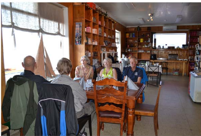
09.09.2014 – Kurs - registrering på Glesvær, Sund