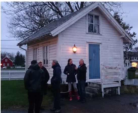
26.10.2014 – Kurs - Kulturminneregistrering på Manger, Radøy