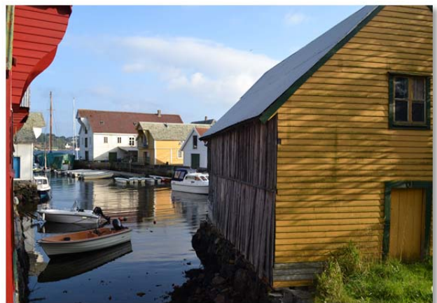
Naustmiljø på Glesvær