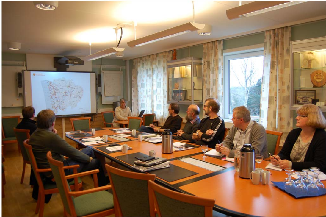
21.03.2014 - Oppstartsmøte Bømlo kommune