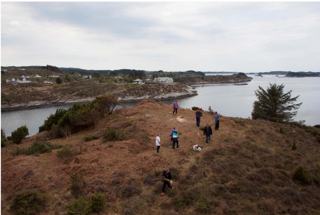
24.04.2014 – Skulebarn i gong med vegetasjonsskjøtsel av ei godt synleg gravrøys like ved brua over Bekkjjarviksundet, Austevoll

Fleire skjøtsels- og formidlingsprosjekt om forhistorie rundt i Hordaland har komme godt i gang og satsinga gjennom BARK « Bevaringsprogram for utvalde arkeologiske kulturminne» er vel motteke i kommunane, jf. PS 129/2014 i Kultur- og ressursutvalet 21.10.2014. Kulturminnevern og museum har prioritert ei stilling til dette arbeidsfeltet. Det var fleire gode samarbeidsprosjekt på skjøtsel og formidling av førhistorie som involverer frivillige, barn, kommune og musea i Hordaland i 2014. Blant desse er skjøtsel og formidling av det største gravfeltet på Hæreid i Eidfjord, og skjøtsel og formidling av freda kulturminne ved Vindenes, Fjell kommune. På Vindenes er det spor frå steinalderen og fram til mellomalder som ligger i urørt landskap. Skolebarn var involvert i vegetasjonsskjøtsel av ei godt synleg gravrøys ved Bekkjjarviksundet i Austevoll.