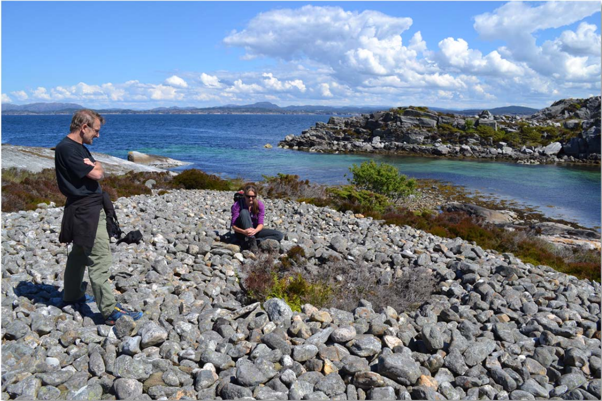
24.06.2014 – Samarbeid med Fjell kommune, Universitet i Bergen og Fjell kommune om kulturminne på Vindeneskvarven.