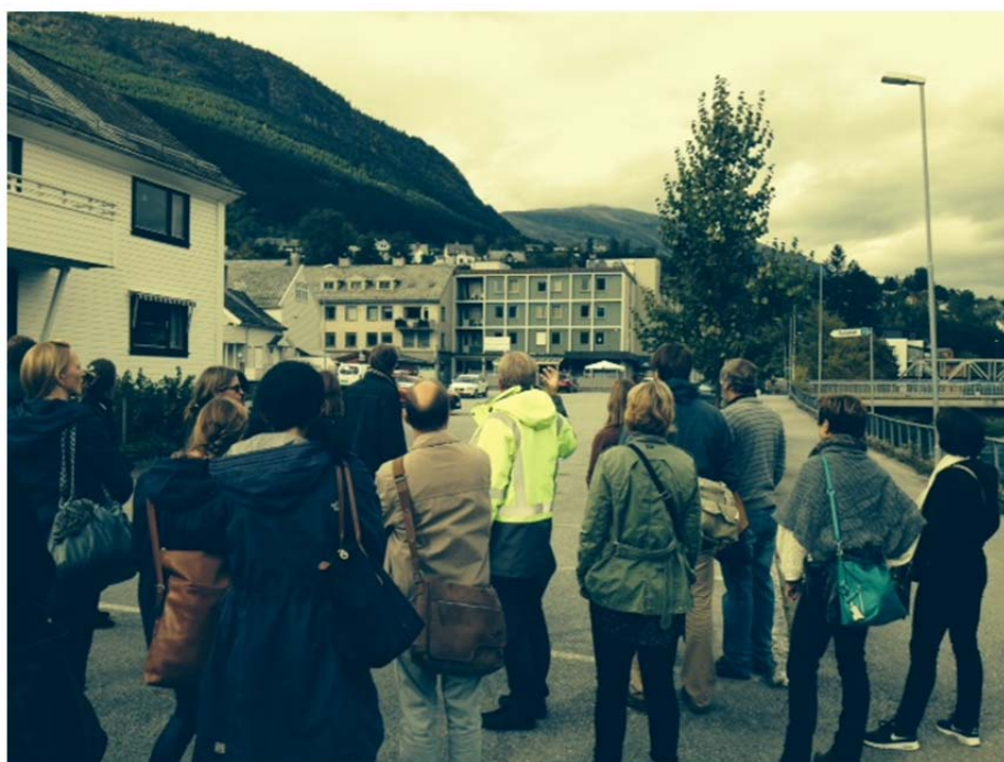
03.09.2014 - Kurs i DIVE-stadanalyse og stadutvikling på Voss