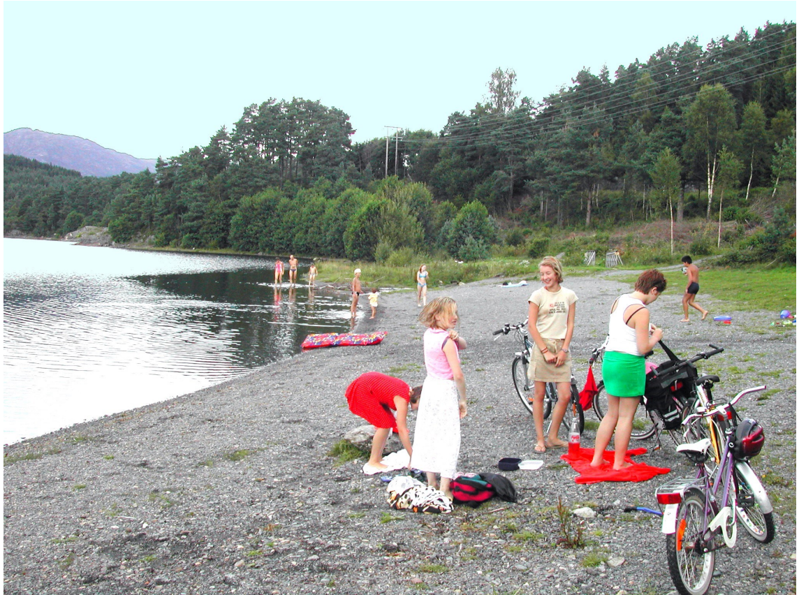
Badestranda ved Ådlandsvatnet