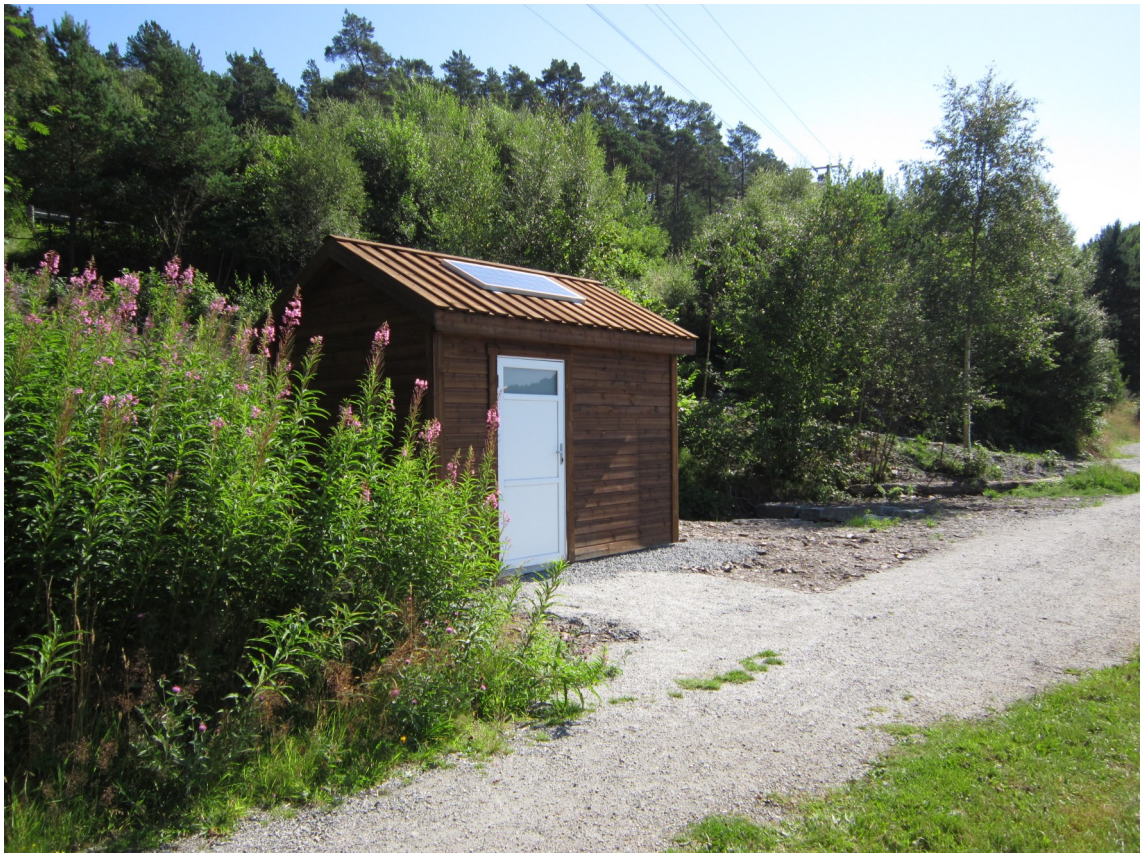
Nytt toalettbygg (2012) ved turvegen og badestranda på østsida av Ådlandsvatnet