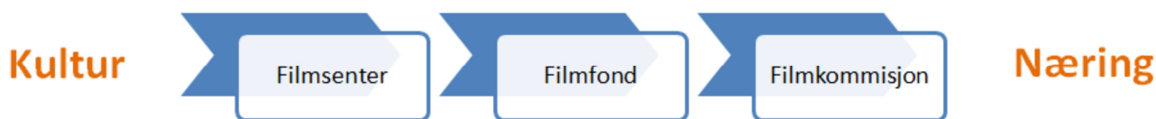
Figur 3 Dei regionale filminstitusjonane si plassering langs aksen kultur versus næring

Problemet er at dei regionale institusjonane er splitta i to sett, eitt for Rogaland og eitt for dei resterande vestlandsfylka. Kvar for seg fungerer institusjonane godt, men dei samla resursane som er til rådvelde, som i seg sjølv er utilstrekkelege, vert ikkje optimalt utnytta når dei vert forvalta av to parallelle strukturar. Ei samordning av dei regionale strukturane er derfor ein føresetnad for å bryte dagens mønster og det første steget mot ein regional filmstrategi .