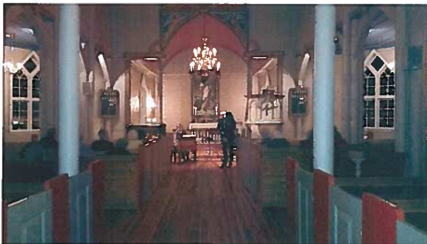
Konserten Solrenning i kyrkja på Ådland.